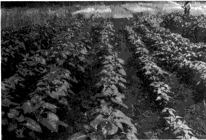
Slika 2. Izgled vegetacije suncokreta na dva tretmana na deponiji pepela

General view of the field experiment on the ash deposits in Obrenovac