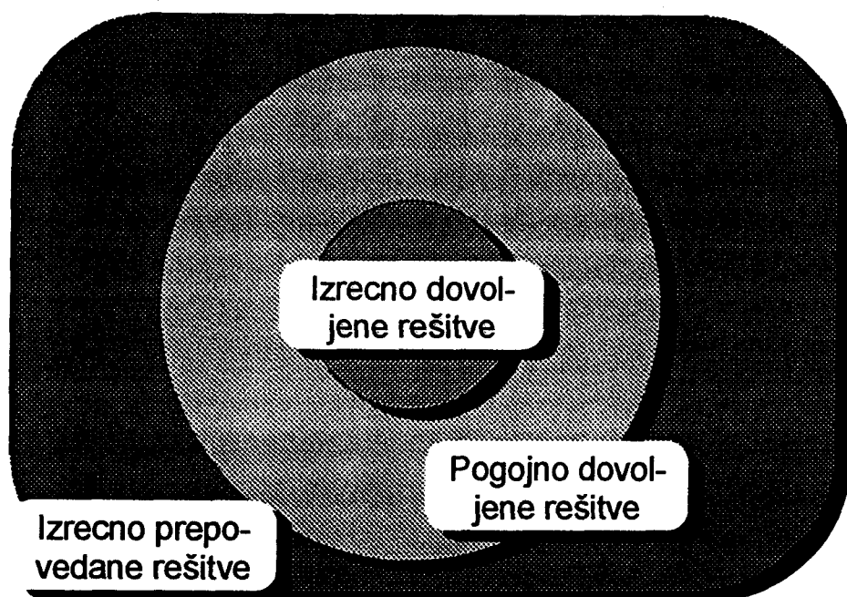
Slika 1: Polja odločitev glede na dovoljeno in nedovoljeno

Med vprašanja o načinih, torej o postopkih pri proizvodnji izdelkov oz. opravljanju uslug, štejejo tudi skladnost teh načinov z državnimi, mednarodnimi normami kot tudi - če problem razumemo širše - z zapisanimi in nezapisanimi pravili poslovnega oz. strokovnega obnašanja, s tradicijo in bontonom. Med rešitvami, ki so izrecno dovoljene in tistimi, ki so izrecno prepovedane, obstaja široko polje - siva cona, v kateri presojamo rešitve tudi po njihovi etičnosti (slika 1). Pogosto nam pri tem manjkajo merila in sodila - zapisana ali nezapisana, kot so tradicionalne navade in običaji. Zapisana pravila, ki ne nosijo obveznosti zakonov oz. predpisov, lahko najdemo v različnih kodeksih poklicne etike, ki utrijujejo stroko in ji dajejo avtonomijo in samozavest (STRITIH 1996, KOŠIR/ANKO 1996).