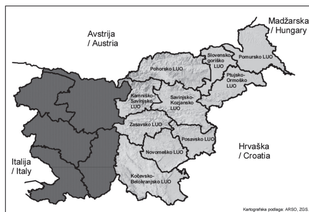
Slika 1: Raziskovalno območje z opredeljenimi lovsko-upravljaljskimi območji

Obravnavano območje je tako z vidika kamninske sestave (karbonatne, magmatske in metamorfne kamnine), pedologije (evtrična in distična rjava tla, rjava pokarbonatna tla, rendzina ter obrečna tla), vegetacije (spreminjajoč delež gozda in gozdnih združb) kot tudi poselitve zelo pestro. Okoljski dejavniki tukaj variirajo v širokih gradientih, zaradi česar lahko pričakujemo, da bomo njihove vplive, če le obstajajo, lahko tudi zaznali.