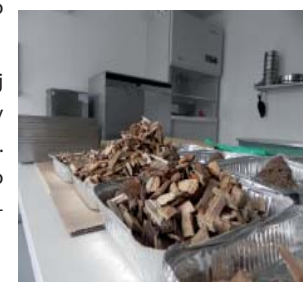
Laboratorij za lesno biomaso na Gozdarskem inštitutu Slovenije

V poskusnem obdobju se je kot najbolj problematična izkazala vsebnost vode, saj je v zimskih mesecih presegala priporočeno (w35). Zato se z dobavitelji sekancev že dogovarjamo o strokovni pomoči pri vpeljevanju sistema spremljanja in zagotavljanja kakovosti lesnih goriv.