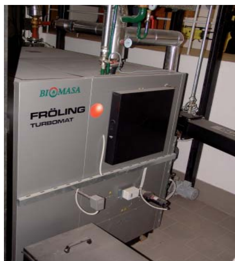
Kotel na lesne sekance proizvajalca Fröling

Investitor v obnovo kotlovnice je lastnik stavbe Republika Slovenija - Ministrstvo za visoko šolstvo, znanost in tehnologijo. S kotlovnico upravlja Gozdarski inštitut Slovenije, ki na podlagi pogodbe na trgu odkupuje lesne sekance ter jih plačuje po dejansko proizvedeni toploti. Gozdarski inštitut si prizadeva, da bi lesne sekance odkupoval od lokalnih dobaviteljev in tako prispeval k razvoju pridobivanja in predelave lesnih sekancev v regiji.