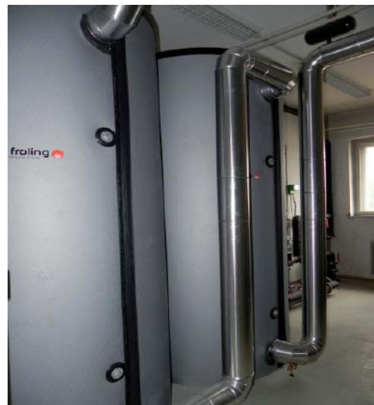
Hranilniki toplote s katerimi izboljšujemo učinkovitost sistema

Proizvodnja toplote je namenjena izključno za ogrevanje in poteka v času kurilne sezone, medtem ko se topla sanitarna voda preko celega leta zagotavlja z električnimi grelniki.