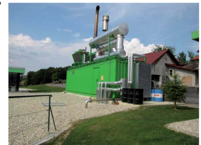
Enota z motorjem MWM je v kontejnerski izvedbi

V maju 2009 je v veljavo stopila nova shema podpre proizvodnji električne energije iz obnovljivih virov. Z to shemo želi držav med ostalimi obnovljivimi viri spodbuditi tudi rabo bioplina za proizvodnjo električne energije. Nova zakonodaja je vplivala na razvoj. Bioplinska naprava ORGANICA ARNUŠ 1 je primer manjše naprave, ki deluje v okviru manjše kmetije in kjer poleg električne energije učinkovito izkoriščajo tudi toploto.