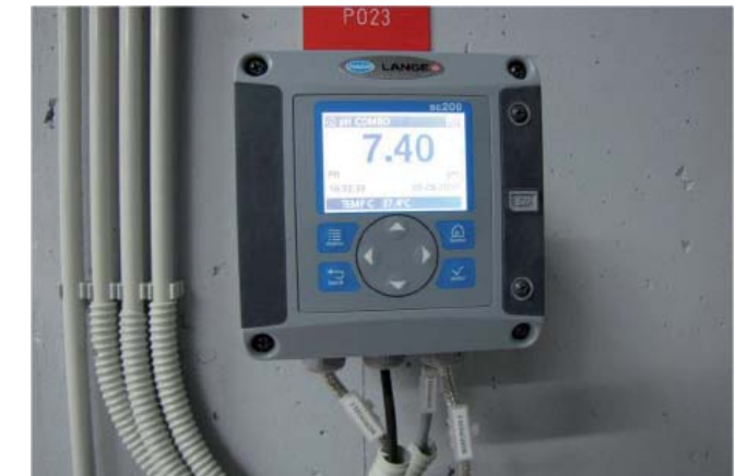
Danes si bioplinske naprave ne moremo predstavljati brez pH-metra, saj mora za pravilno delovanje anaerobne fermentacije obstajati ustrezno okolje. Na sliki je prikazan valnik pH-metra in temperature substrata v digesterju.

Predelani substrat iz bioplinske naprave se ločuje v separatorju in nato še dodatno suši v sušilnici, ki ravno tako uporablja termalno energijo iz bioplinske naprave. Posušeni substrat se na kmetiji uporabi za gnojenje kmetijskih površin in rastlinjakov, kjer se prideluje zelenjava. Del predelanih substratov pa kot organsko gnojilo prevzemajo kmetje, ki v bioplinsko napravo vozijo gnoj in gnojevko. Substrat se potencialno lahko prodaja tako za gnojilo kot tudi za gorivo.