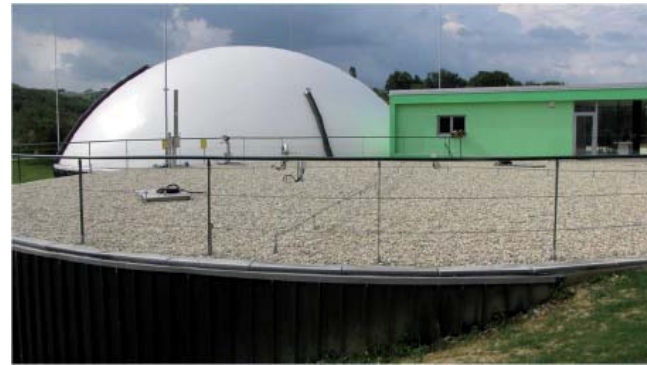
Pri Arnušu sta dva digesterja pokrita z betonsko ploščo, na tretjem digesterju pa je plinohram za bioplin.

Bioplinsko napravo Organica Arnuš 1 je zgradilo podjetje Keter Organica. Ta ponuja svojo tehnologijo na ključ. Bioplinska naprava obratuje v srednjem - mezofilnem temperaturnem območju (37 °C) v anaerobnem okolju brez kisika. Zadrževalni ali retencijski čas v digesterju je 60 do 80 dni. Polnjenje in praznjenje bioplinske naprave poteka kontinuirano. Digesterji so izdelani iz betona. Dva digesterja sta pokrita z betonsko ploščo, na tretjem digesterju pa je plinohram. Bioplin iz digesterjev se vodi v plinohram, od tam pa do motorja z notranjim izgorevanjem. Motor MWM proizvaja mehansko energijo, ki se v prigradenem generatorju spreminja v električno energijo.