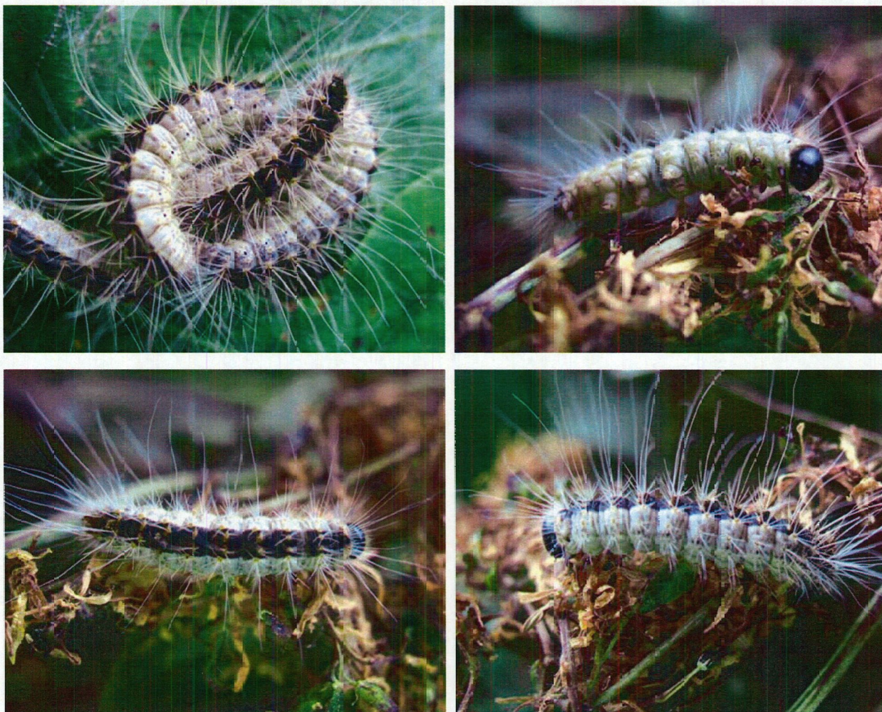
Slika 2, 3, 4,5. Gosenice hrastovega sprevodnega prelca.