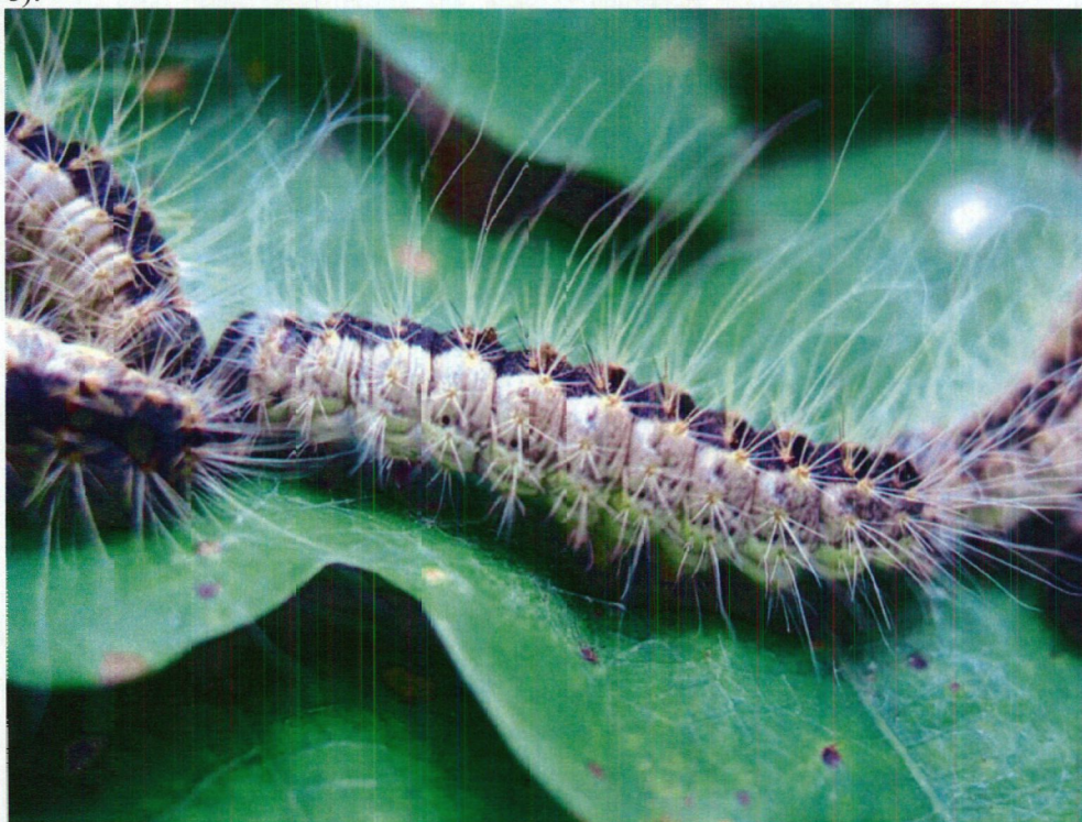
Slika 8. Premikanje gosenic v »sprevodu« (slovensko ime vrste!).

Gosenice se v zapredkih levijo in iztrebljajo. Z rastjo gosenic se povečujejo gnezda, ki lahko dosežejo velikost manjše melcne. Včasih več manjših gnezd oblikuje skupno gnezdo. Gosenice so čez čan v gnezdu, ponoči gredo na žrtje, v zgodnjih jutranjih urah se vračajo v gnezda (slika 8).