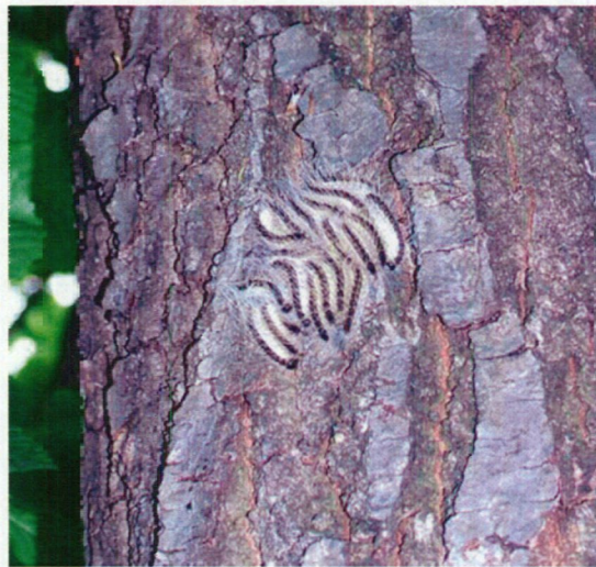
Slika 6.7. Gnezdo hrastovega sprevodnega prelca v rahlem zapredku na deblu.

Gosenice se v zapredkih levijo in iztrebljajo. Z rastjo gosenic se povečujejo gnezda, ki lahko dosežejo velikost manjše melcne. Včasih več manjših gnezd oblikuje skupno gnezdo. Gosenice so čez čan v gnezdu, ponoči gredo na žrtje, v zgodnjih jutranjih urah se vračajo v gnezda (slika 8).