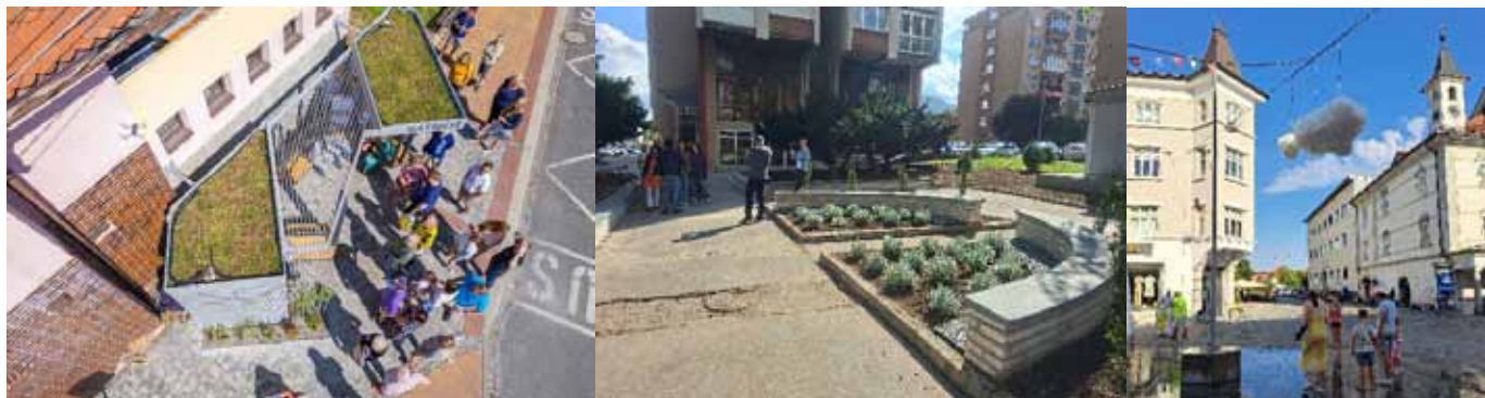
Slika 2: Be Ready pilotne aktivnosti v Ratibořju, Zenici in Kranju

zmanjšuje lokalno pregrevanje in povečuje ugodje uporabnikov. V Zenici v Bosni in Hercegovini so v stanovanjski soseski dodatno uredili zelene površine, ki zmanjšujejo temperaturo in izboljšujejo kakovost zraka ter prispevajo k večji kakovosti bivanja. V Kranju so v središču starega mestnega jedra namestili oblak s pršilnikom vode, ki omogoča aktivno hlajenje urbanega prostora in povečuje ugodje obiskovalcev (slika 2).