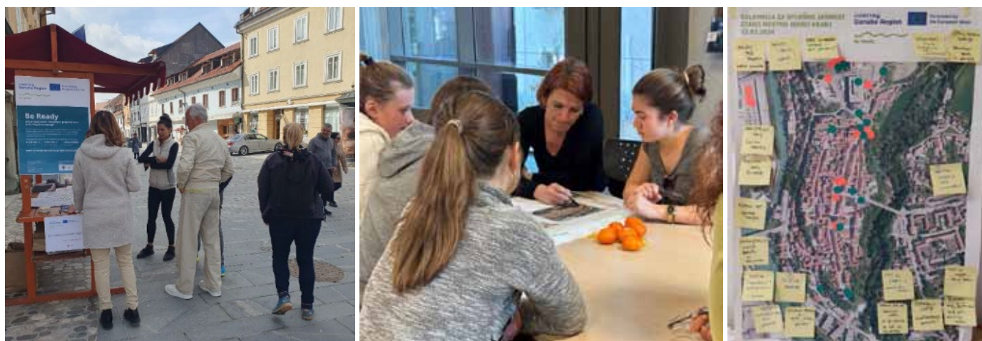
Slika 3: Proces sodelovanja javnosti

Rezultati raziskave potrjujejo, da je usklajevanje varstvenih režimov in blaženja UTO kompleksen izziv, ki zahteva sočasno usklajevanje ciljev ohranjanja dediščine in prilagajanja podnebnim spremembam. Zgodovinska mesta so zaradi morfološke strukture, goste zazidave in omejenih prostorskih možnosti za posege med območji, najbolj izpostavljenimi toplotnemu stresu, in zato tudi med najranljivejšimi. Varstveni režimi, ki so usmerjeni v ohranjanje identitete prostora, pogosto omejujejo uporabo tehničnih rešitev, kot so trajni elementi za senčenje, ozelenjevanje ali uporaba reflektivnih materialov.