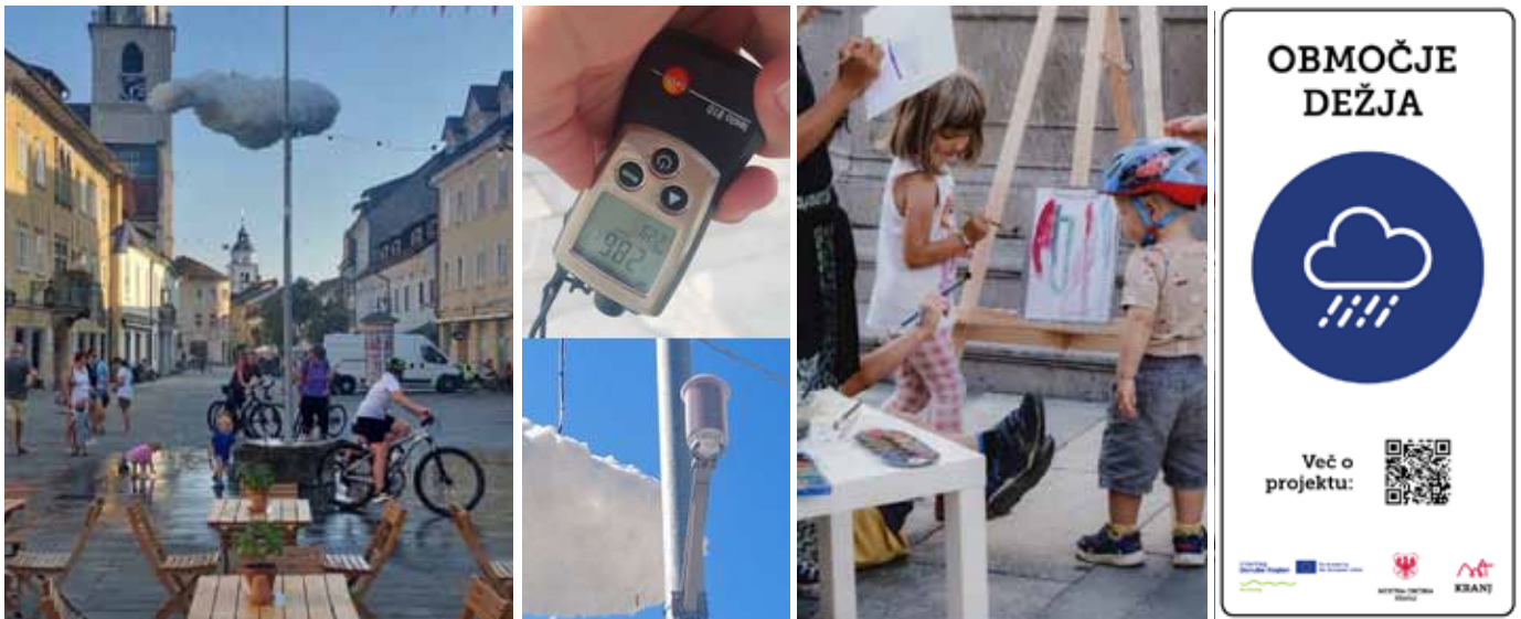
Slika 4: Pilotni ukrep v starem mestnem jedru Kranja

Študija primera mesta Kranj potrjuje, da lahko začasni ukrepi prispevajo k zmanjševanju toplotnega stresa, hkrati pa delujejo kot orodje za preizkušanje rešitev v nekem prostoru, za preverjanje družbene sprejemljivosti ter ozaveščanje javnosti in odločevalcev.