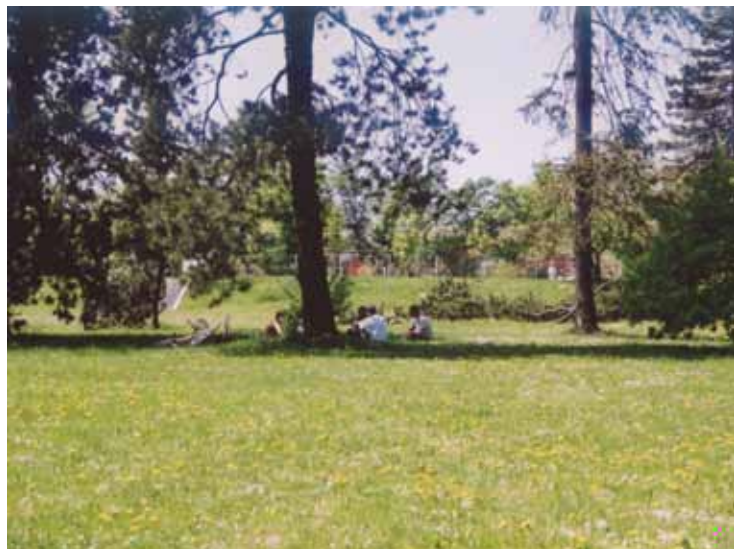
Slika 4: Mestni park prispeva k izboljšanju mikroklimе in toplotnega ugodja v mestnem okolju ter služi kot prostor za druženje in socialne interakcije