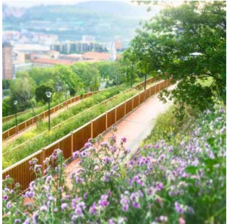
Slika 3: Ozelenjena sprehajalna pot na mestnem pobočju, kjer vegetacija prispeva k zmanjševanju toplotnega stresa ter izboljšuje mikroklimatske razmere