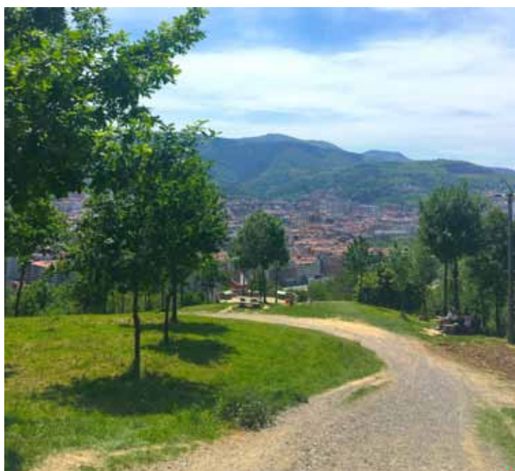
Slika 2: Mestni park z drevesno senco in travnatimi površinami zmanjšuje lokalni toplotni stres in izboljšuje toplotno ugodje v urbanem okolju

Zelene površine so med najučinkovitejšimi naravnimi ukrepi za blaženje negativnih vplivov UTO. Z zagotavljanjem senčenja in evapotranspiracije izboljšujejo mikroklimatske razmere ter zmanjšujejo temperaturne eks-