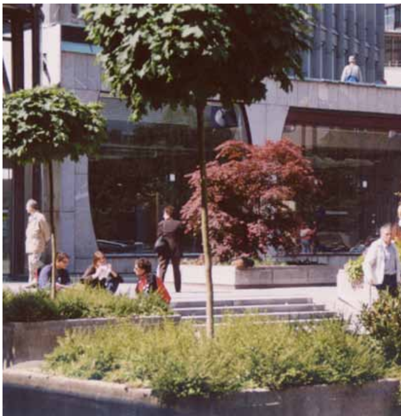
Slika 1: Urbana javna ploščad z drevesi in drugo trajno zasaditvijo

S tega vidika imajo zelene površine, kot so parki, drevoredi, zelene strehe in tudi zasebni vrtovi, ključno vlogo pri blaženju negativnih posledic pregrevanja mest. Z zniževanjem lokalnih temperatur, izboljševanjem kakovosti zraka in zagotavljanjem senčnih območij so pomemben element trajnostnega urbanističnega načrtovanja. Poleg fizioloških učinkov prinašajo zelene površine tudi pomembne psihološke in družbene koristi, saj spodbujajo rekreacijo, družbeno interakcijo ter občutek povezanosti z naravo.