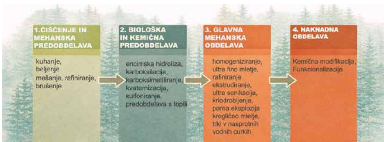
Slika 2: Shema proizvodnega procesa pridobivanja CNF

Pridobivanje nanofibrilirane celuloze (NFC): Proces pridobivanja nanofibrilirane celuloze je sestavljen iz večih faz in poteka s kombinacijo kemičnih, encimskih in mehanskih postopkov (Nechyporchuk in sod., 2016), prikazanih na Sliki 2. Mehanski postopki predstavljajo ključni korak pri razvlaknjevanju celične stene. Različne kemične in encimske predobdelave izboljšajo morfologijo končnega produkta in zmanjšajo potrebno energijo za mehansko obdelavo (Nechyporchuk in sod., 2016). Sam proizvodni proces ima veliko parametrov, odvisnih od surovinskega vira in željenih končnih lastnosti CNF.