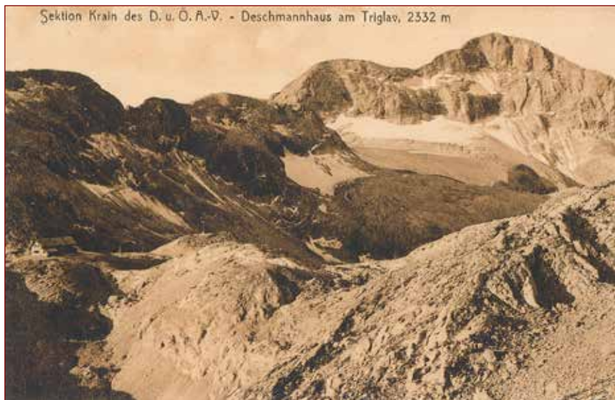
Deschmanhaus pod Triglavom.

vana z zaključnim stavkom njegovega nastopa, ki se je glasil: » Und du, Altvater Triglav, strecke deine Hand schützend über unsere deutsche Erde « (v prevodu In ti, oče Triglav, iztegni svojo roko in varuj našo nemško zemljo). 10