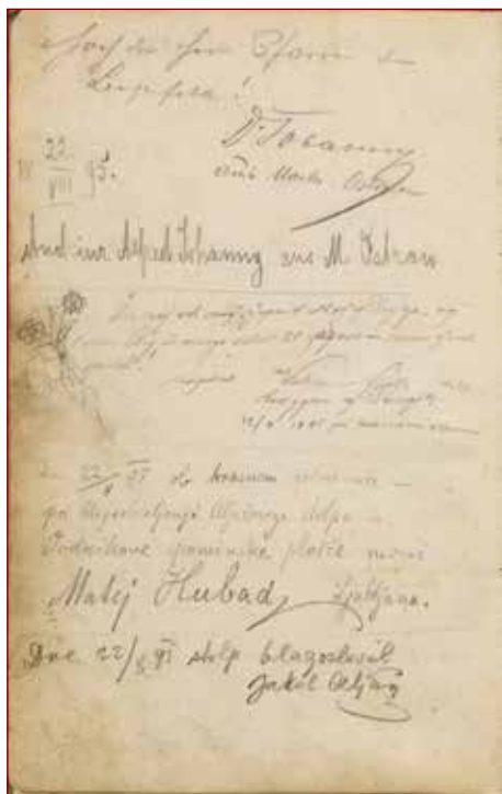
Vpis blagoslovitve stolpa na Triglavu 22. avgusta 1895.

Posebej zanimiv je podatek o strukturi obiskovalcev. V tem letu je bilo med vpisanimi le 13 žensk, kar priča o tem, da je bil vzpon na Triglav še vedno predvsem domena moških. 54 Prvih šestnajst vpisov v knjigi je bilo v celoti zapisanih v nemščini, šele nato so se začeli pojavljati slovenski zapisi. Skupaj jih je bilo več kot polovica, natančneje 120 v nemškem jeziku in 64 v slovenskem, nekaj tudi v italijanščini in češčini, dva vpisa v angleščini ter dva v latinščini. Posebej pri slovenskih imenih v nemškem zapisu lahko sklepamo, da gre pogosto za posledico šolske izobrazbe oziroma načina pisanja, ki so ga obiskovalci prevzeli v uradnem življenju. Pri domačinih pa so se ohranili povsem ljudski zapisi, skupaj s hišnimi številkami in domačimi imeni, kar daje knjigi dodaten etnografski pomen. 55