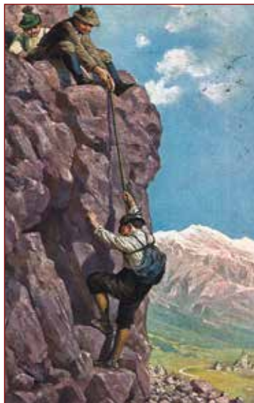
Planinstvo in alpinizem se je v drugi polovici 19. stoletja zelo razširil po Alpah.

V Habsburški monarhiji je planinstvo kot organizirana dejavnost začelo živeti po sprejetju svobodomiselnih zakonov o društvih v 60. letih 19. stoletja. Ti so omogočili ustanavljanje kulturnih, izobraževalnih in športnih društev, med katera je sodilo tudi planinstvo. Prvo alpsko planinsko društvo je leta 1862 nastalo v Avstriji 2 , kmalu so mu sledila švicarsko in italijansko društvo, leta 1869 pa še nemško. 3 Nemško planinsko društvo, ki se je pozneje z združitvijo avstrijskega preimenovalo v Nemško-avstrijsko planinsko društvo (Deutscher und Österreichischer Alpenverein – DÖAV), je v nekaj desetletjih postalo najmočnejša organizacija v Alpah. Združevalo je številne člane, imelo bogate finančne vire in natančno zastavljeno strategijo, ki je obsegala gradnjo planinskih koč, urejanje poti ter skrbno širjenje svojega vpliva v gorskih območjih, ki so jih imeli za pomembne. 4