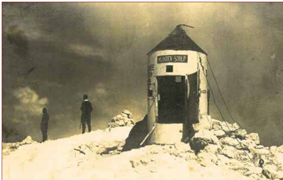
Aljažev stolp.

»Vzamem besedo nazaj. Nisi norec, samo velik zanesenjak si. In velik Slovenec. Zdaj sem šele sprevidel, da le taki ljudje premikajo svet. Da bom tudi jaz nekaj prispeval k slovenski stvari, ti obljubim: stolp bom dokončal v najkrajšem možnem času in to – zastonj! Da bo Triglav res slovenski!« 27