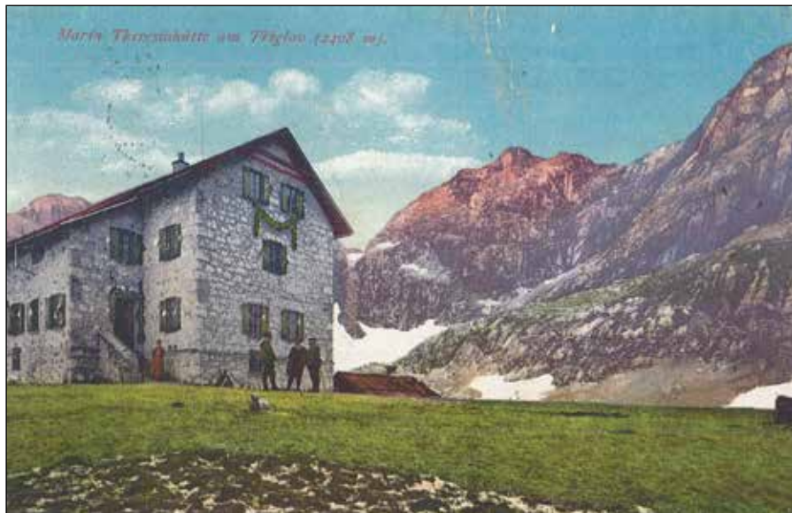
Maria Theresia-Hütte pod Triglavom.

imaginariju prostor skupne dediščine, naravne lepote in močne simbolne vrednosti. Na terenu pa je bil ta prostor zaznamovan s tujimi napisi, nemškimi kočami in vodniki, ki so bili sicer domačini, a so delovali v okviru nemških društev in pravil. 11