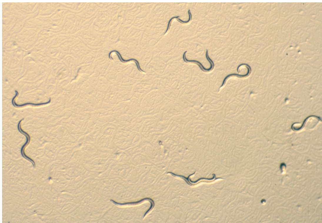
Slika 2: Infektivne ličinke entomopatogene ogorčice vrste Heterorhabditis bacteriophora

EO so učinkoviti agensi za zatiranje škodljivcev (KLEIN, 1990). Spekter uporabe EO je zelo širok, lahko