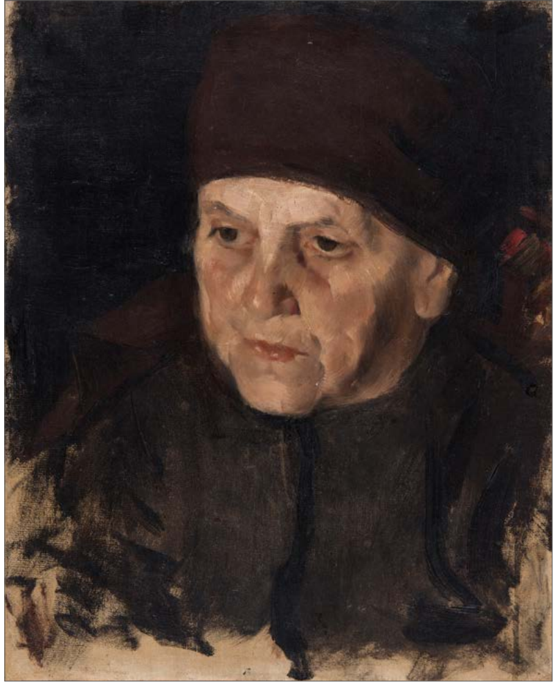
4. Ivana Kobilca: Starka, ok. 1885, Narodna galerija, Ljubljana

kateri sta upodobljeni deklici v izbi, ki si z občudovanjem ogledujeta narodno nošo, avbe, rokavice in židane rute. 14 Vse to sta našli v skrinji stare mame, kar učinkuje skoraj kot ponazoritev njene vloge pri ohranjanju (narodne) tradicije in običajev.