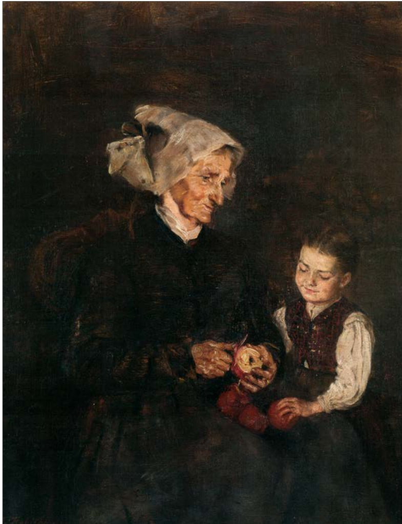
2. Ivana Kobilca: Babica z vnukinjo, 1886–1887, zasebna last (Ciber, Jaki in Simončič, Ivana Kobilca)

realističnim vizualnim opisom obeh protagonistk. Glede na ikonografijo spada ta slika med značilna dela svojega časa, saj inscenira novo vlogo starih staršev, kakršno je tedaj med drugim propagiral revijalni tisk s svojimi ilustracijami.