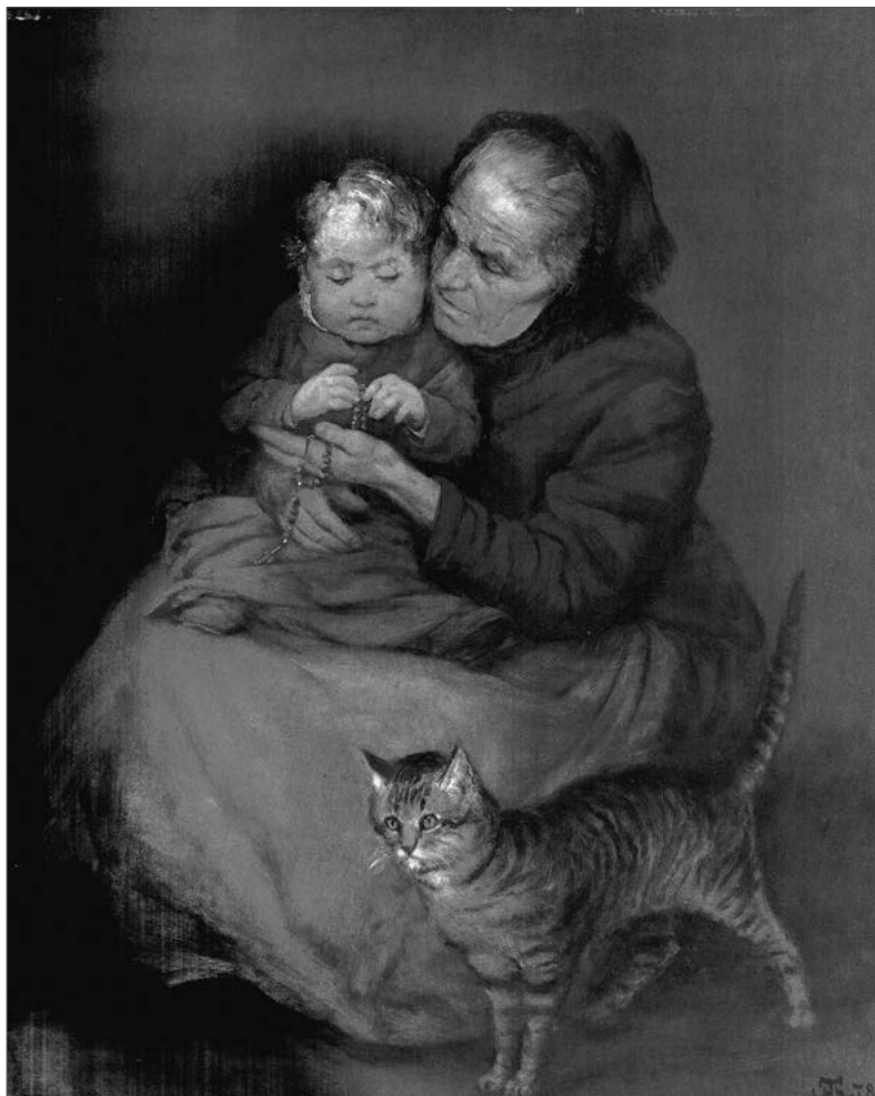
3. Hans Thoma: Stara mati, otrok in mačka , 1878, Neue Pinakothek, München (Ruhmer, Der Laibl-Kreis )

Thoma je s svojimi idealiziranimi podobami, kakršna je oljna slika Stara mati, otrok in mačka iz leta 1878 (Neue Pinakothek v Münchnu), naletel na zelo hvaležno občinstvo, saj je doživel izjemno priljubljenost (sl. 3). 13 Slika vsebuje značilno anekdotičnost, ki je bila sicer tuja Leiblovemu krogu. Tako vsebuje to delo tudi značilne aluzije na vero in družinske vezi, ki so skupne obema osebam na sliki.