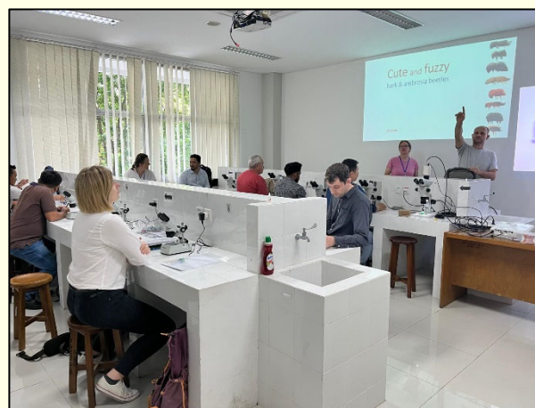
Slika 2: Delo v laboratoriju za klinično parazitologijo Medicinske fakultete Univerze Brawijaya, kjer udeleženci spoznavajo tehnike morfološke identifikacije podlubnikov na referenčni zbirki, ki jo je priskrbel Univerza na Floridi

Ambrosiophilus atratus , Abrosiodmus rubricollis , Ips duplicatus , Anisandrus maiche , Xylosandrus compactus ) (Hauptman in sod., 2024). Poznavanje morfologije in ekologije podlubnikov je ključnega pomena za hitro odzivanje in pripravo ukrepov v primeru pojava škodljivega organizma, ki bi lahko ogrozil in povzročil škodo v slovenskih gozdovih.