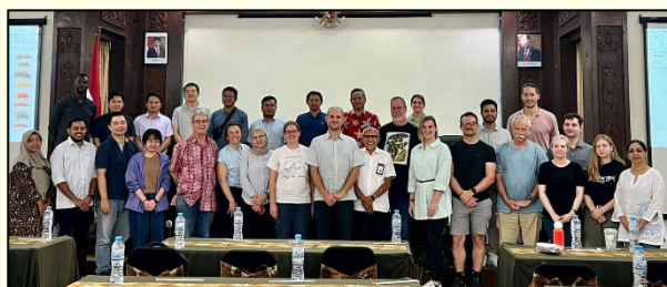
Slika 1: Skupinska slika udeležencev na izobraževanju Bark and Ambrosia Beetle Academy na Univerzi Brawijaya v Malangu

Podlubniki (Scolytinae) so ekološko pomembna skupina organizmov, ki predstavljajo vse večje varstvene probleme. V svetu je opisanih več kot 4300 vrst podlubnikov, ki jih pretežno najdemo v tropskem in subtropskem svetu. Več kot 3000 vrst je skozi evolucijo razvilo ekološko strategijo prehranjevanja s simbiotskimi glivami. Takšen način prehrane imajo ambrozijski podlubniki, ki v gostitelja prenesejo glivo, ki se nato razrašča v lesu gostitelja in omogoči vir hrane hroščem v času razvoja (Allison in sod., 2023). V različnih delih sveta prihaja do vse več pojavov obsežnejših napadov invazivnih tujerodnih ali avtohtonih podlubnikov. Povezani so s podnebnimi spremembami in s povečanimi pojavi intenzivnejših suš, padavin in ujm, kjer podlubniki naselijo oslabljena in sveže podrti drevesa (Singh in sod., 2024). Višje temperature pogosto pozitivno vplivajo na razvoj podlubnikov ter jim omogočajo naselitev prej neprimeren habitatov, saj se gostitelji pogosto zaradi temperaturnih sprememb znajdejo v fiziološkem stresu, kar zmanjša njihovo vitalnost in poveča dovzetnost za napade podlubnikov. S tem pa lahko sekundarni organizmi ob velikih namnožitvah postanejo primarni škodljivci (Allison in sod., 2023).