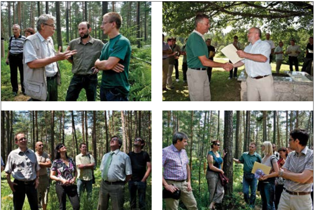
Slika 6-9: Zaključne delavnice projekta Life FutMon v l. 2011 na ploskvi IM na Brdu pri Kranju. Figure 6-9: The final workshops of the Life FutMon project in 2011 on the IM plot at Brdo pri Kranju.

V državah članicah EU (DČ) je bilo financiranje aktivnosti različno; v nekaterih so programe zmanjševali (Avstrija, Danska, Madžarska idr.), v nekaterih so jih ohranjali (Nemčija, Francija ...). Po prenehanju veljavnosti zakonodaje EU, ki je določala izvajanje IM, in po prehodu odgovornosti iz direktorata EU, odgovornega za kmetijstvo, na okoljski direktorat, je sofinanciranje zlasti po koncu projekta Life Futmon (2011) usahnilo, DČ pa so same odločale o nadaljnjem spremljanju. K sreči so se mnoge države, med njimi tudi Slovenija, odločile, da bodo program izvajale na obeh ravneh tudi po ukinitvi sofinanciranja EU. Zaradi spremenljivosti podnebja, velikopovršinskih