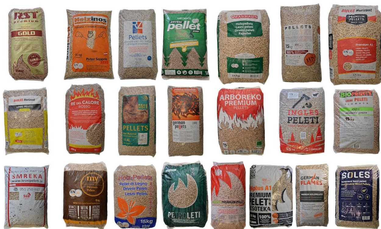
Slika 1: Vreče peletov vključene v analizo kakovosti v letu 2024

Objavljeno na spletu 30.09.2024 ( https://doi.org/10.20315/10.20315/IG.2024.0046 )