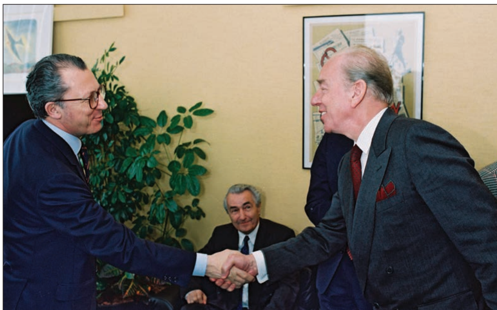
Slika 1: Rokovanje med Budimirjem Lončarjem na desni strani in Jacquesom Delorsom, Bruselj, 8. marec 1990. V ozadju tedanji predsednik Vlade SFRJ Ante Marković.

element nejasnosti je bila tudi spremenjena geopolitična situacija v srednji in vzhodni Evropi, ki jo je za sabo pustilo leto 1989. Za Jugoslavijo se tako v Bruslju ni več vedelo, ali bi se jo umestilo v sredozemsko soseščino EGS ali v skupino nekdanjih evropskih socialističnih držav, h katerim se je obračal bruseljski fokus in za katere so se že pripravljali obsežni finančni aranžmaji. Ne da bi razpolagali s konkretnimi informacijami, so se ugotovitve, da je Jugoslavija zdrsnila na lestvici prioritet EGS zavedali tudi v Beogradu, kjer je na seji omenjene komisije zveznega izvršnega sveta bilo tudi ugotovljeno, da še zdaleč ni več jasno, v katerem od koncentričnih krogov, sestavljenem iz nečlanic okrog jedra EGS, naj bi se po novem znašla Jugoslavija: najbrž »nekje med tretjim in četrtem«.