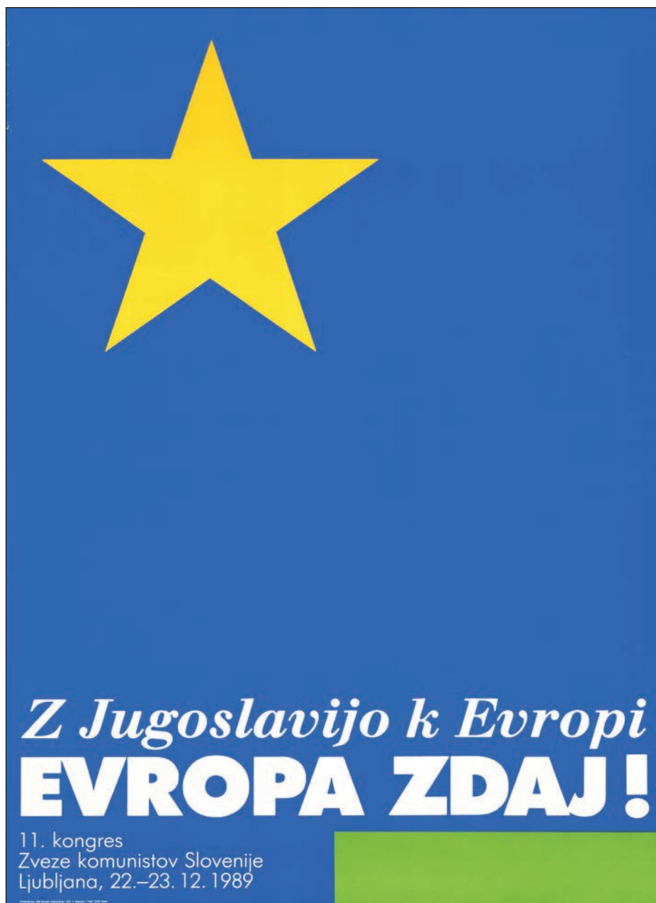
Slika 2: »Plakat Evropa zdaj!«: 11. kongres Zveze komunistov Slovenije, Ljubljana, 22.–23. 12. 1989.