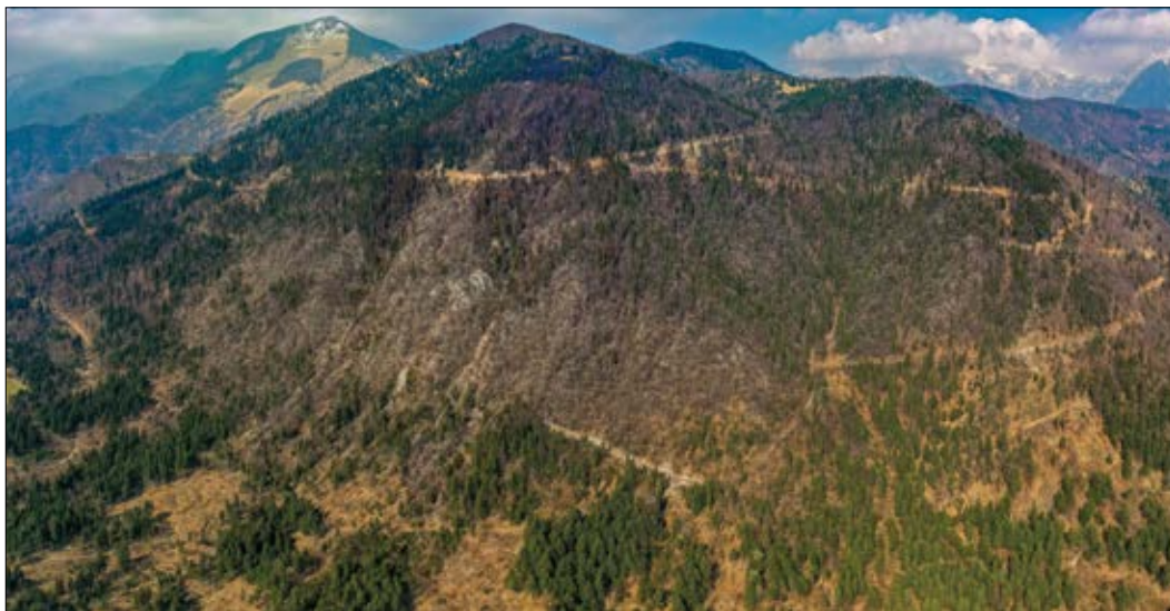
Slika 1: Potoška gora tik po požaru

Pri gašenju požara se je pokazal izjemen pomen ustrezne odprtosti gozdov s prometnicami in bližine jezera Črnjava za zajemanje vode. Gozdna cesta v gradnji je omogočila dostop in posredovanje gasilcev v zgornjem delu pobočja, ki so tako uspeli zadržati širjenje ognja proti severu in zahodu. Brez te dostopne poti bi se požar razširil na veliko večji površini. V veliko pomoč je bila tudi bližina jezera Črnjava v Preddvoru, da so bili cikli zajemanja in izpusta vode s helikopterji zelo kratki. Dobro sodelovanje ZGS, lokalne skupnosti in drugih služb je potekalo že pred požarom, saj so intervencijske službe imele ključne od zapornice