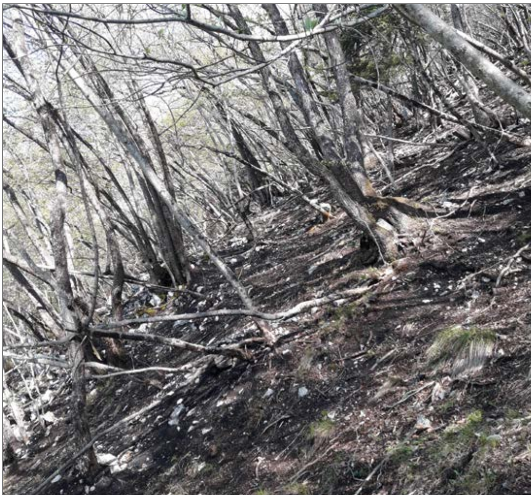
Slika 4: Sestoj črnega gabra v drugi enoti (, 11. 4. 2022)

na ekstremnih rastiščnih (čeri, drče, melišča) na spodnji oz. južni polovici požarišča, ki jih poraščajo termofilni listavci s posamično ali skupinsko primesjo smreke in bukve. Manjši del površine te enote je na grebenu Babe na vzhodnem delu požarišča, kjer prevladujejo redki sestoji smreke s posameznimi macesni. Proti Čemšeniku pa so nedostopni bukovi gozdovi s primesjo termofilnih listavcev. Lesne zaloge so majhne, drevje je tršato in slabe kakovosti. Ogenj je drevje večinoma poškodoval v pasu korenničnika, debelejša drevesa so poškodovana nekaj metrov po deblu, praviloma na zavetrni legi. Poškodbe so drevje fiziološko oslabile, vendar pričakujemo, da bo