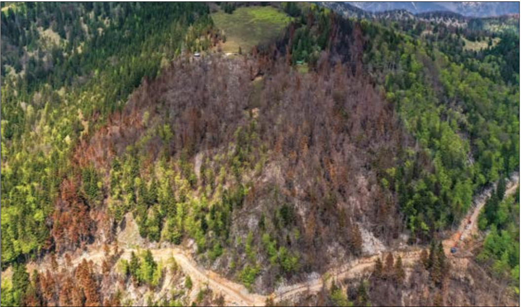
Slika 2: Zelo poškodovani sestoji v prvi enoti; smreka je rjava, zelo ožgana bukev ne odganja.

Figure 2: Severely damaged stands in the first unit – spruce is brown, severely burnt beech does not sprout