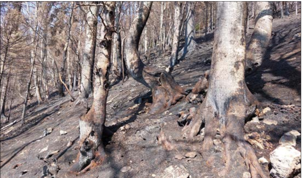
Slika 3: Prva enota – velike poškodbe na smreki, bukvi in na gozdnih tleh

Figure 2: Severely damaged stands in the first unit – spruce is brown, severely burnt beech does not sprout