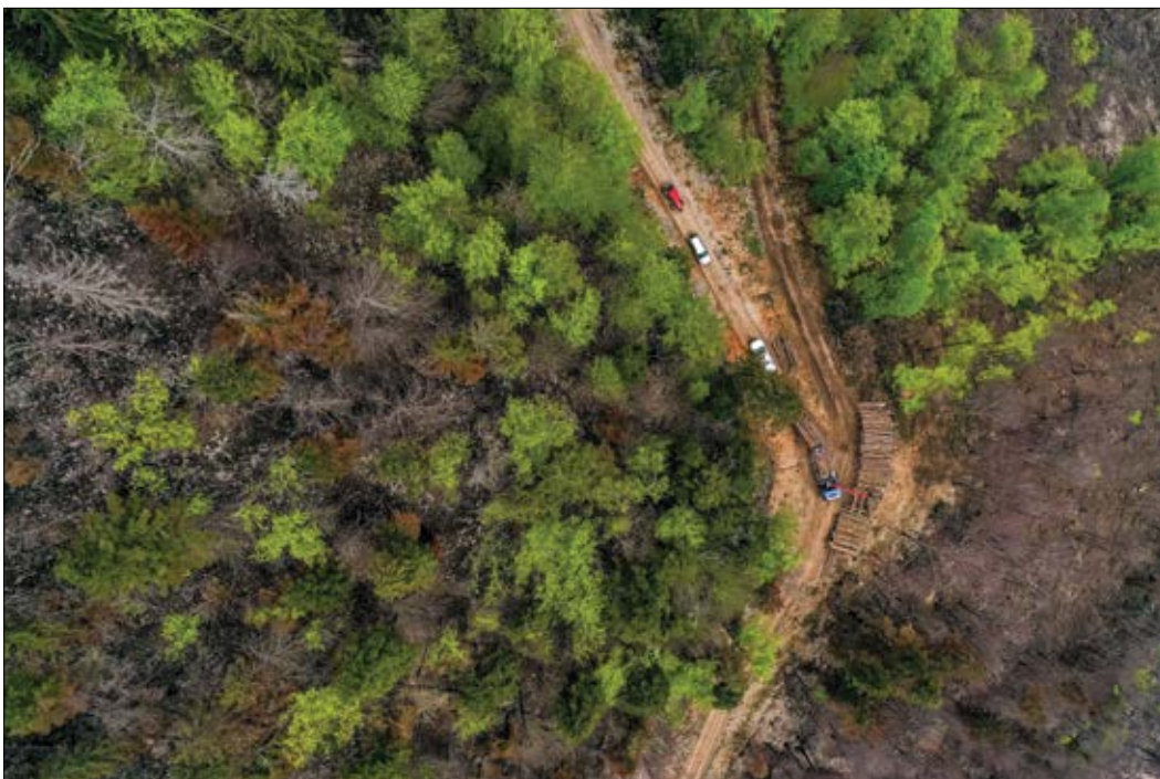
Slika 5: Izvajanje sanacije – ožgane bukve so se po olistanju začele sušiti (10. maj 2022).