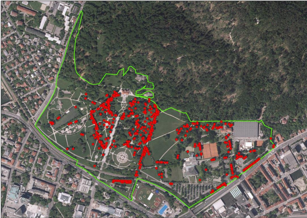
Slika 3: Prostorska razporeditev primernih habitatnih dreves z verjetnim pojavljanjem puščavnika ( Osmoderma eremita ) v mestnem parku Tivoli.