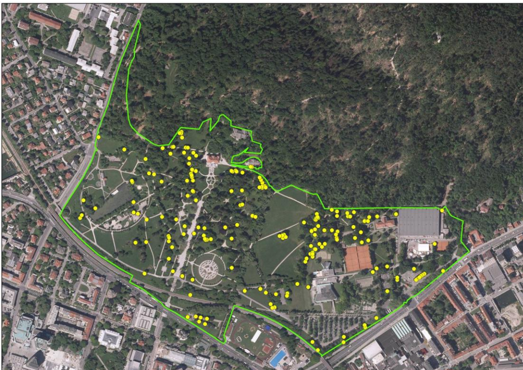
Slika 4: Prostorska razporeditev primernih habitatnih dreves z možnim pojavljanjem puščavnika ( Osmoderma eremita ) v mestnem parku Tivoli.