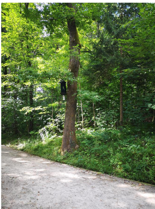
Slika 2: V letu 2020 smo na območju Krajinskega parka Tivoli, Rožnik in Šišenski hrib izvedli tretje snemanje razširjenega monitoringa. Na sliki je primer feromonske pasti, ki je bila postavljena ob Jesenkovi poti.

Za ugotavljanje prisotnosti puščavnika smo uporabili prestrezne viseče feromonske pasti (Slika 2; glej podrobnosti v Vrezec s sod. 2014). Pasti so bile aktivne od 2. 7. 2020 do 16. 7. 2020. Na območju Krajinskega parka Tivoli, Rožnik in Šišenski hrib smo v letu 2020 postavili 39 feromonskih pasti v sklopu razširjenega monitoringa puščavnika, ki vključuje tudi pasti iz spremljanja učinkov naravovarstvenega ukrepa za puščavnika v Tivoliju. 14 pasti smo postavili na območju mestnega parka Tivoli (vključuje tudi pasti iz spremljanja učinkov naravovarstvenega ukrepa za puščavnika v Tivoliju), tri na območju Kosez, ostalih 22 smo postavili na območju Rožnika in Šišenskega hriba.