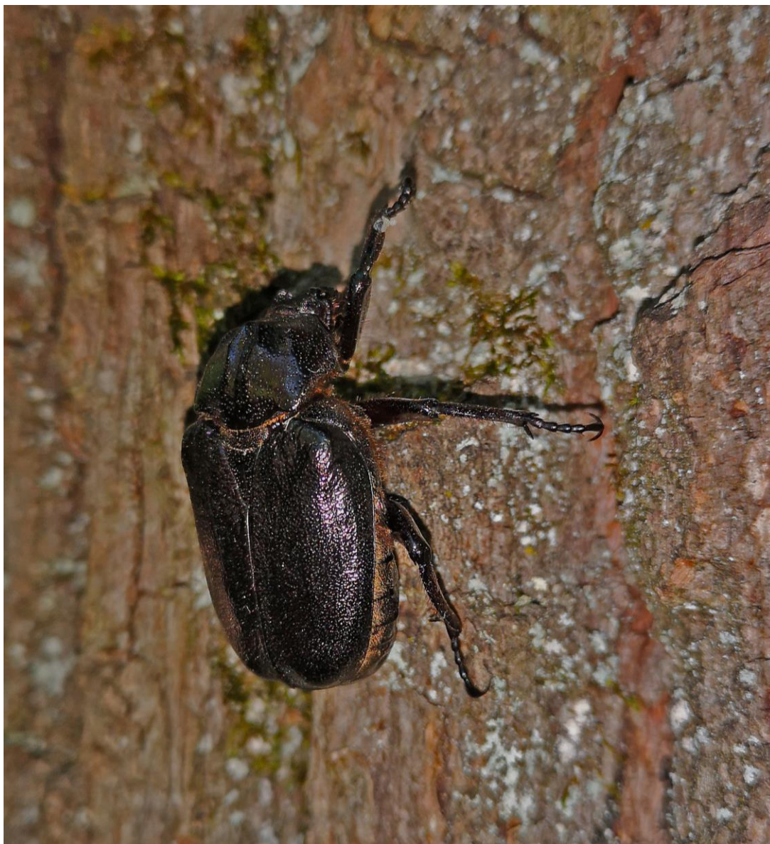
Slika 1: Samec zahodnega puščavnika ( Osmoderma eremita ) ulovljen v pasti na Jesenkovi poti.

Pričujoče poročilo zajema poleg ekspertnega svetovanja tudi dva dela monitoringa: