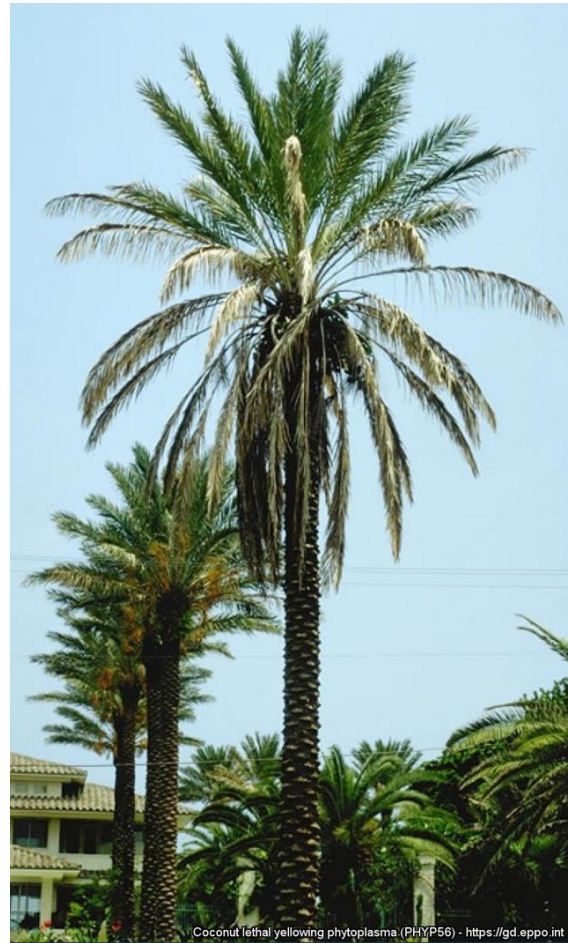
Slika 1: Rumenenje listov palm okuženih s fitoplazmo

Od okužbe do pojava prvih bolezenskih znamenj lahko preteče več mesecev. Na okuženih palmah se najprej pojavi bledenje oziroma rumenenje listov (enako kot v primeru abiotičnega stresa), kasneje zaradi okužbe palme propadejo.