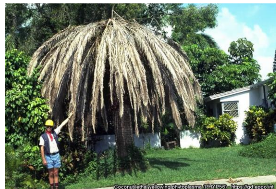
Slika 2: Palma propadla zaradi okužbe s fitoplazmo