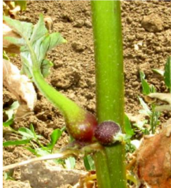
Slika 3: Pojav nadzemnih gomoljev na stebelu krompirja okuženega s ' Ca. P. solani '

http://www.nib.si/zaznavanje-mikroorganizmov-rastlinskih-patogenov