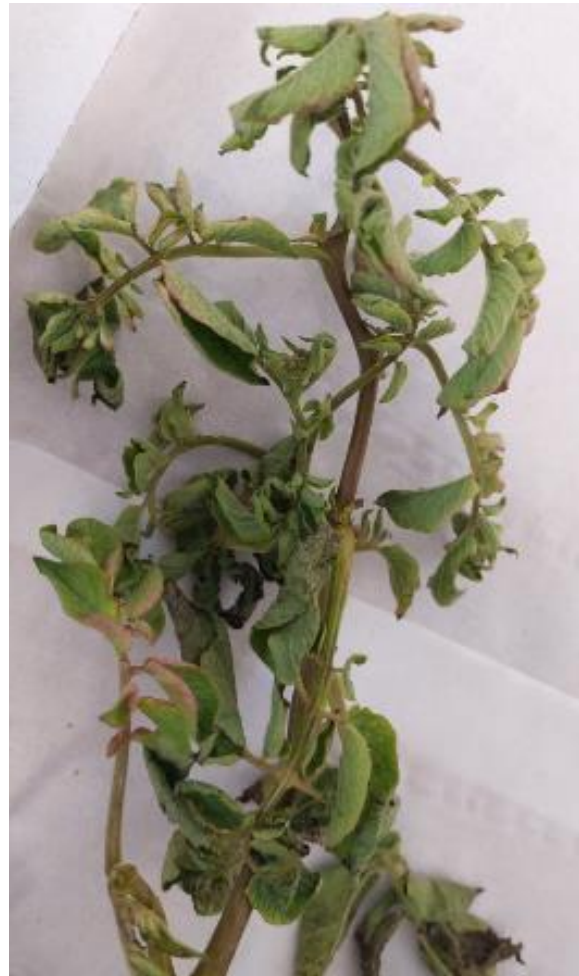
Slika 1: Uvihavanje in rdečenje listov krompirja v katerih smo potrdili prisotnost fitoplazme iz skupine stolbur (vključuje ' Ca. P. solani ') (vzorec D672/21)

Za fitoplazme, ki so uvrščene v prilogo II/A Izvedbene Uredbe Komisije (EU) 2019/2027 ni znano, da bi se pojavljale na ozemlju Evropske Unije, oziroma so zabeležene zgolj posamične najdbe. ' Ca. P. solani ' pa je bila potrjena v številnih državah v Evropi in tudi drugod.