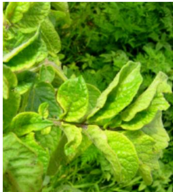
Slika 2: Rumenenje in uvihavanje listov krompirja okuženega s ' Ca. P. solani '