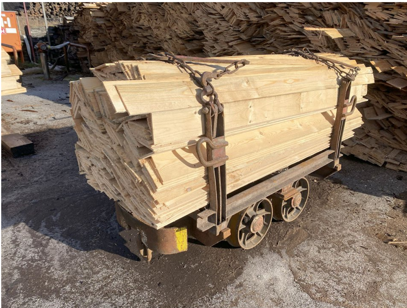
Primeri lesnih proizvodov podjetja PLP d.o.o.