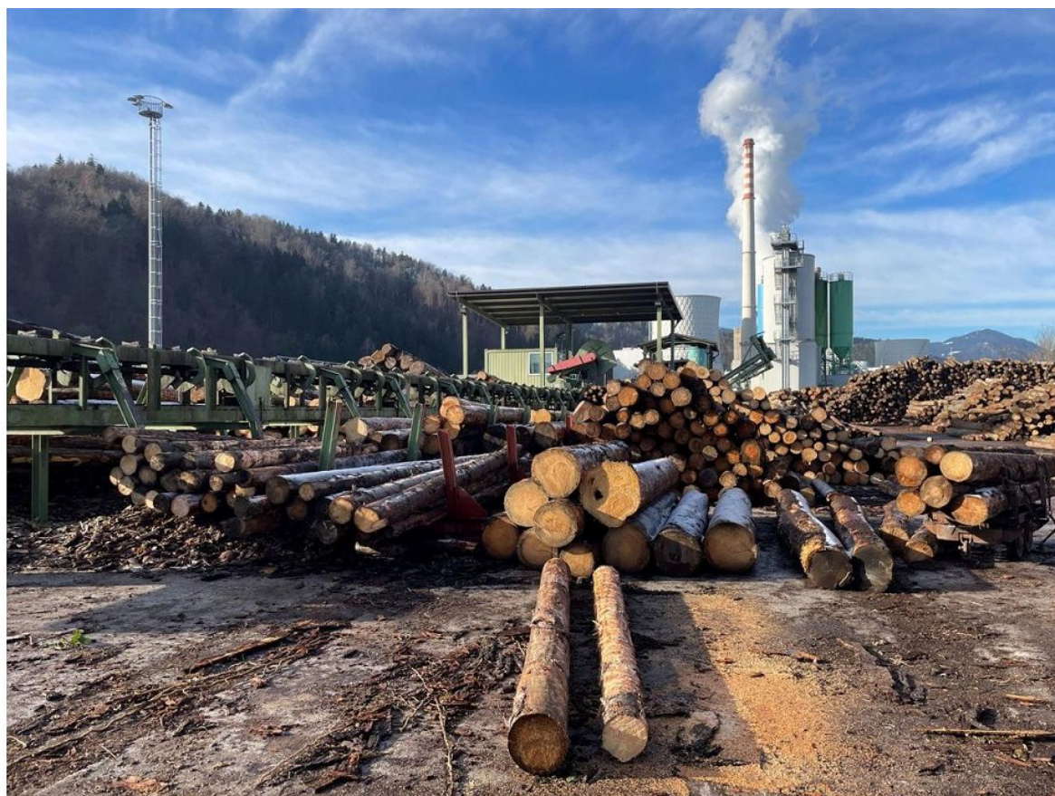
Del skladišča hlodovine