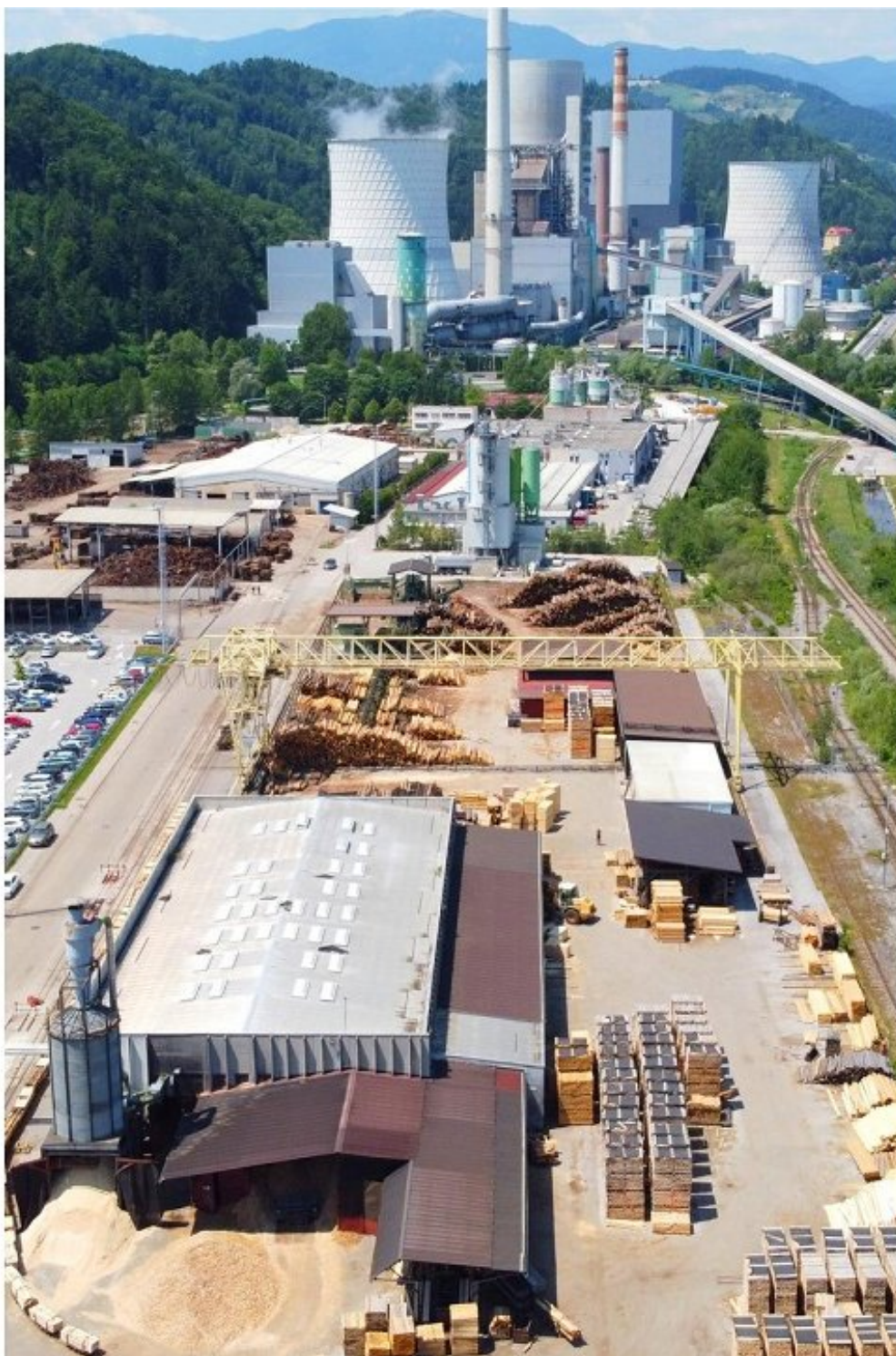
Lokacija podjetja PLP d.o.o.

Podjetje spada v delovno intenzivno panogo in deluje 100 % na primarni predelavi lesa, in sicer na programih jamskih opažev, gradbenem lesu, konstrukcijskem lesu, pragovih in proizvodnji lesne biomase. Poleg slovenskega trga podjetje deluje tudi na določenih trgih EU in trgih nekdanje Jugoslavije. V lasti imajo dve žagi, kjer razžagujejo hlodovino iglavcev in listavcev srednje do slabše kakovosti. Količina razžagane hlodovine letno ob obratovanju ene izmene in pol znaša do 20.000 m 3 . Zaradi uvajanja tehnoloških posodobitev in visokih cen hlodovine, je bila količina razžagane hlodovine po višku doseženem v letu 2021, v zadnjih dveh letih nekoliko nižja.