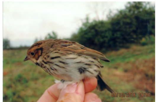
Slika 3: Mali strnad Emberiza pusilla, Medvedce, Pragersko, Slovenija, 9. 10. 2016, obroček AH 32398