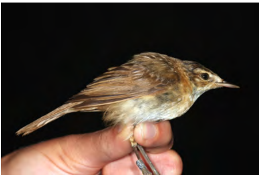
Slika 2: Plevelna trstnica Acrocephalus agricola, Verd, Vrhnika, Slovenija, 16. 9. 2016, obroček KV10363