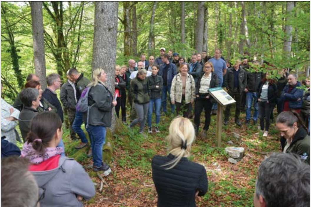
Slika 4: Na delavniškem delu dogodka smo si ogledali tudi Podsteniško koliševko, udornico, zavarovano kot naravni spomenik, ki je izločen iz gospodarjenja kot gozdni rezervat.