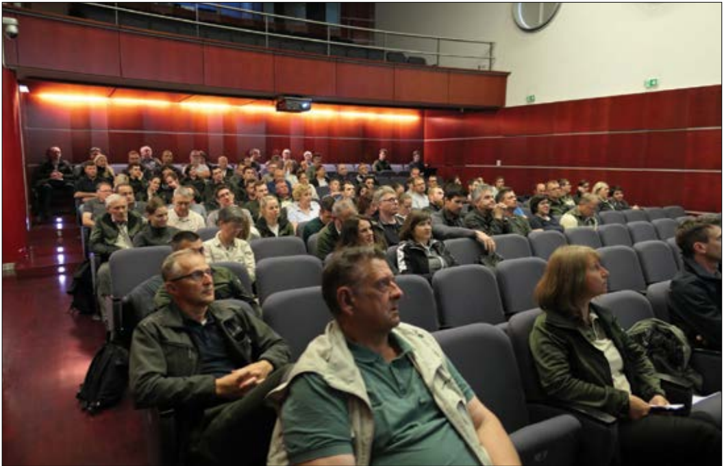
Slika 3: Udeleženci 14. seminarja in delavnice iz varstva gozdov v Dolenjskih Toplicah (foto: N. Ogris).