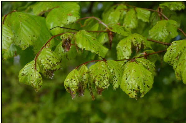
Slika 4: Poškodbe na bukovih listih.

škodljivih dejavnikov, ki povzročajo kompleksno bolezen. V tem procesu sicer sodeluje tudi bukov rilčkar skakač, vendar je bil tudi v tej raziskavi prispevek vrste k obsegu poškodovanosti bukve ocenjen za majhnega.