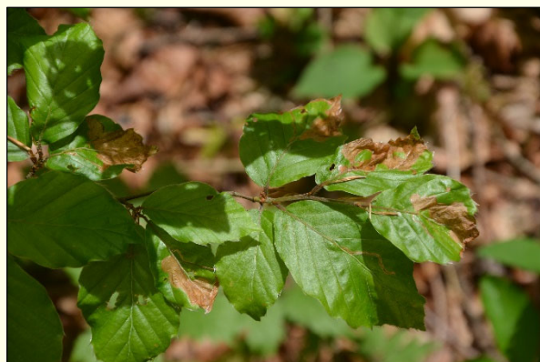
Slika 3: Poškodbe na listih nastale zaradi hranjenja ličink.

Vpliv bukovega rilčkarja skakača na odraslo bukev je običajno majhna, ob močnem napadu pa lahko sadike zaradi poškodb oslabijo. Namnožitve se pojavljajo nepričakovano in razmeroma trajajo kratek čas, kar pomeni da naslednje leto bukev ponovno normalno odžene.