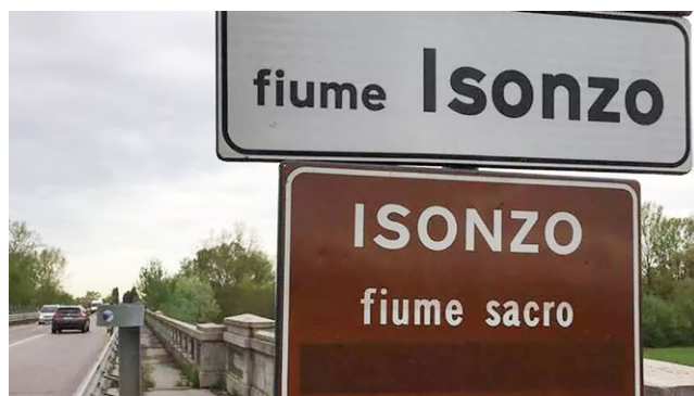
Slika 3: Obcestna tabla pred mostom čez Sočo v Italiji 95

Na italijanski strani meje južno od Gorice pred mostom čez Sočo stoji občestni napis »Fiume sacro« – sveta reka (gl. sliko 3). Svetost Soče je za patriotske Italijane povezana s soško fronto. Kjer teče po slovenskem ozemlju, je za maloštevilne morda tudi danes sveta še iz drugih razlogov.