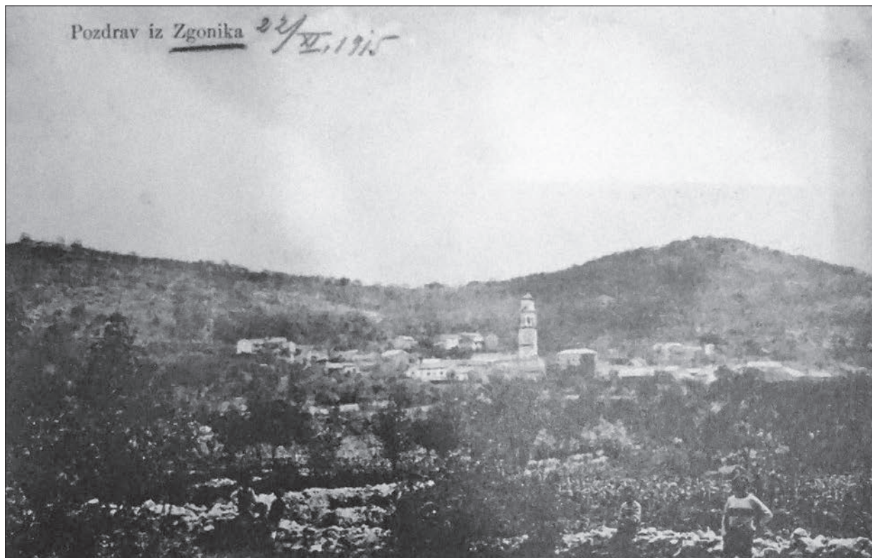
Zgonik na začetku 20. stoletja (Škrabec, Narod naš dokaze hrani , str. 105).