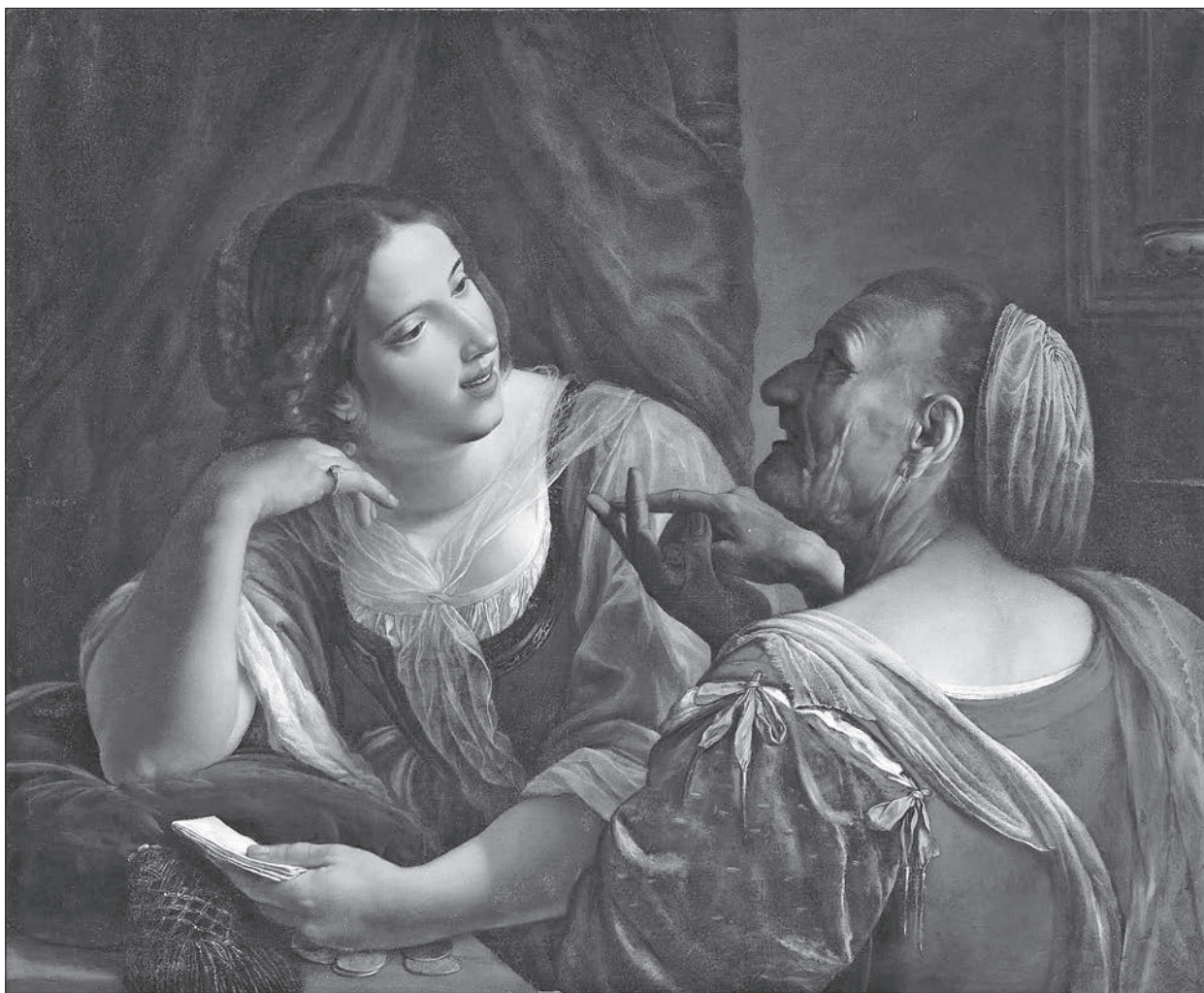
Angelo Caroselli: Alegorija Mladosti in Starosti, ok. 1615.