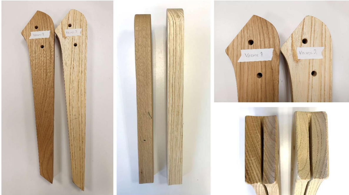
Slika 1: Dostavljene lesene noge stola.

Januarja 2024 nam je ga. Zvonka Kobe v laboratorij dostavila dva kosa lesa, ki sta sestavna dela podnožja lesenega stola z namenom identifikacije lesne vrste ( Slika 1 ). Po trditvah trgovca oz. proizvajalca naj bi bila omenjena kosa iz lesa hrasta. Pripravili smo manjše orientirane vzorce (prečni, radialni in tangencialni prerezi) za makroskopsko identifikacijo ter trajne prečne preparate za svetlobno mikroskopijo oz. mikroskopsko identifikacijo lesa.