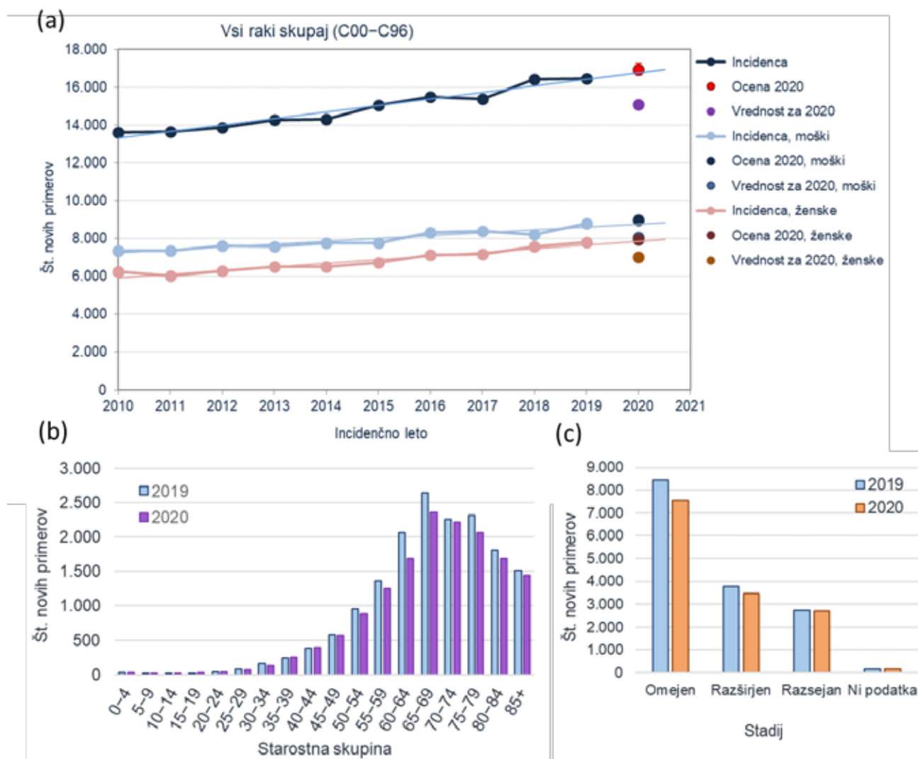
Slika 1: Desetletni trendi incidence za vse rake skupaj z odstopanjem od napovedi za leto 2020 (a) ter primerjava incidence v letih 2019 in 2020 po 5-letnih starostnih skupinah (b) in po stadiju za solidne rake (C00–C80) (c).

Predstavljen manko novih primerov raka v prvem letu epidemije covida-19 je še nekoliko večji od pričakovanega na osnovi sprotnega spremljanja med epidemijo na delnih podatkih OnKOvida, saj smo na podlagi analiz iz portala OnKOvid ocenili, da bo manko diagnoz v letu 2020 približno 6 % (8). Čeprav primerjava z drugimi državami ni neposredno primerljiva, saj gre pri vsaki od analiz za nekoliko drugačen metodološki pristop, pa vseeno lahko glede na objavljene rezultate iz drugih držav ugotovljamo, da je manko novih bolnikov z rakom v Sloveniji primerljiv kot v Angliji, ZDA in Kanadi ter nekoliko večji v primerjavi s Škotsko in Švedsko (Tabela 2).