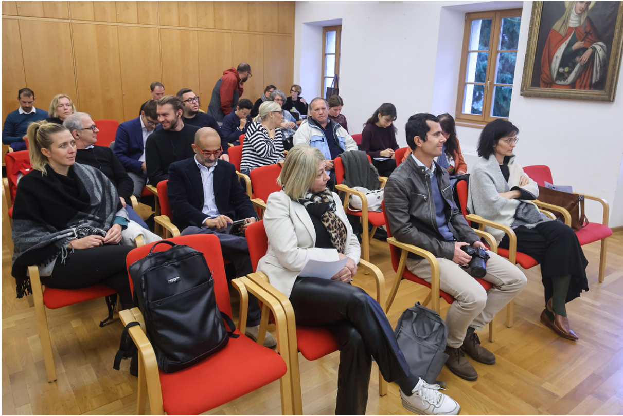
Foto-utrinki iz konference/ Immagini dalla conferenza