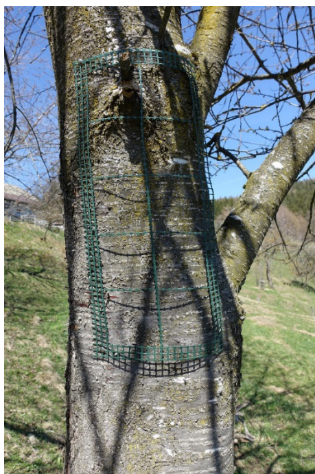
Slika 3: Vzorčevalni mrežici za popis po VDI metodi

Nemška metoda VDI temelji na popisu izbranih vrst epifitskih lišajev na najbolj obraslem delu debla, na ka-