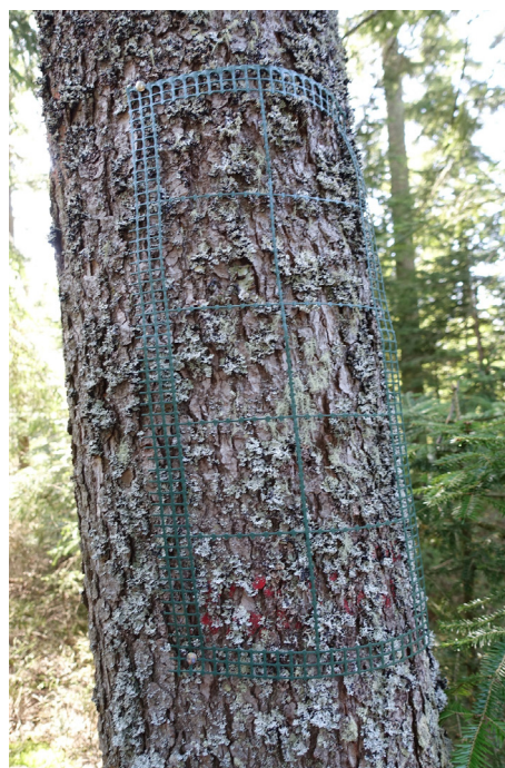
Fig. 3: Sampling grids for the survey according to the VDI method