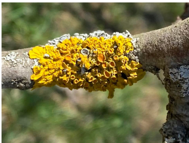
Slika 1: Xanthoria parietina (levo) ter Lecanora sp. (desno)

Najpogosteje je bilo izbrano sadno drevje, in sicer češnja ( Prunus avium L.), sliva ( Prunus domestica L. subsp. domestica ) in hruška ( Pyrus communis L.). Prvi dve vrsti spadata v skupino dreves s kisljo skorjo, hruška pa v skupino drevesnih vrst z zmerno kisljo skorjo. Ponekod smo vključili tudi nekatere listavce (lipovec – Tilia cordata Mill., gorski javor – Acer pseudoplatanus L. oziroma ostrolistni javor – Acer platanoides L. in vrste iz rodu Quercus sp.). Lipovec in gorski javor imata zmerno kisljo skorjo; hraste pa uvrščamo v skupino dreves s kisljo skorjo (Kirschbaum in Wirth, 1997). Izbrali smo drevesa primerne starosti; tj. obseg drevesa več kot 40 cm, brez poškodb debla in zunaj sadovnjakov, da bi se izognili mogočemu vplivu škropljenja na vrstno sestavo lišajev (Vidregar-Gorjup, 2002). Lišaje