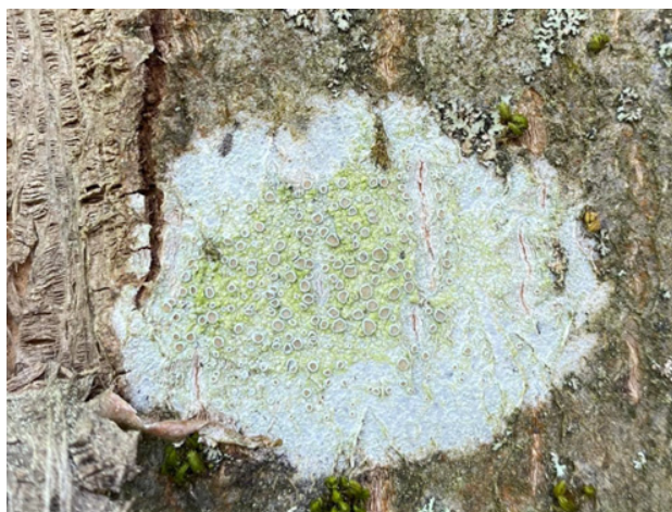
Fig. 1: Xanthoria parietina (left) and Lecanora sp. (right)