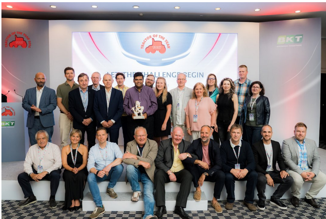
Slika 1: V žiriji sodeluje 25 kmetijskih revij iz 25 evropskih držav. Na sliki so člani žirije in direktor sponzorja izbora BKT.

Izbor traktorja leta poteka v štirih kategorijah. Za leto 2024 se je vabilu žirije odzvalo 9 proizvajalcev traktorjev, ki so skupaj predlagali 13 kandidatov. V odprti kategoriji Traktor leta (Tractor of the year; brez omejitev lastnosti) kandidirajo štirje proizvajalci traktorjev, in sicer Claas Xerion, Fendt, Massey Ferguson in Valtra. Trenutno o samih kandidatih na željo proizvajalcev ne moremo povedati kaj več, niti objaviti slik, čeprav se slike nekaterih že pojavljajo na družbenih omrežjih. Gre za nove modele oz. serije in proizvajalci želijo kupce še nekaj časa držati v pričakovanju. Pri Claasu za novo serijo Xerion bodo podrobnosti na voljo po 18. juliju. Informacije za Fendt bodo na voljo po 26. septembru, za Valtro po 30. oktobru, za Massey Ferguson pa po 12. novembru. Vsi kandidati so že tudi finalisti, saj jih je skupaj manj kot pet.