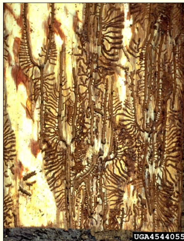
Slika 2: Rovni sistem Ips duplicatus

Vrsta I. duplicatus je bila leta 2020 prvič najdena v Sloveniji (Kavčič in sod. 2023a), in sicer v pasteh v oko-