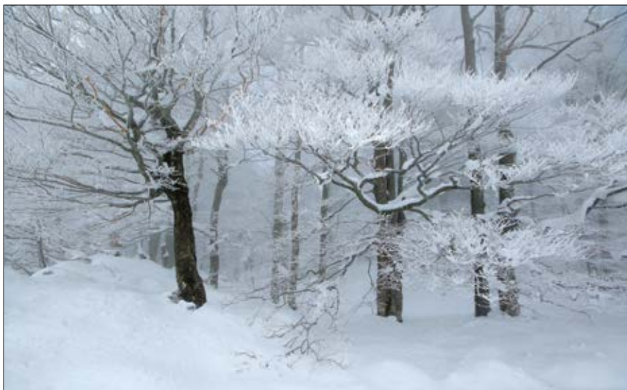
Slika 3: Zimski gozd

Gašper BEVC Slovenski državni gozdovi, d. o. o.