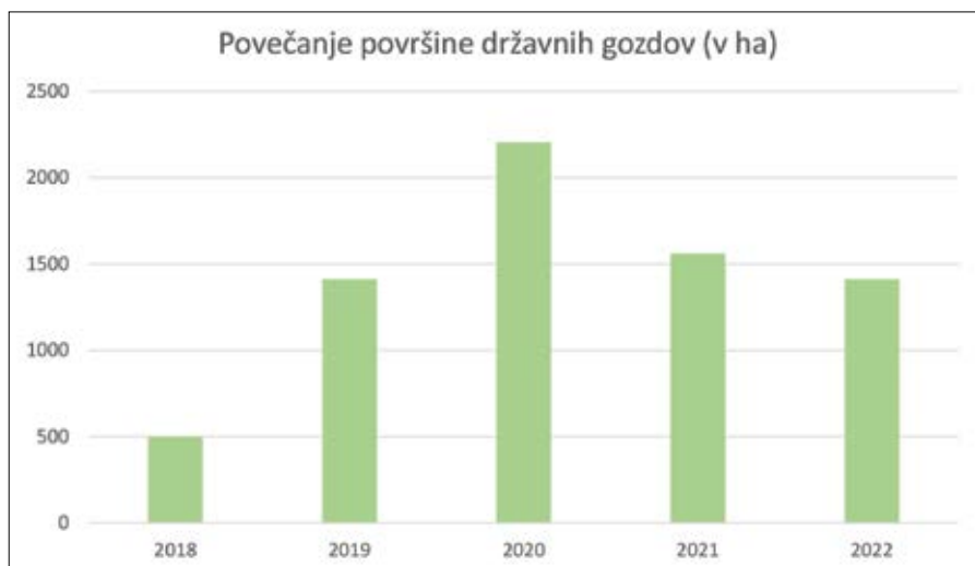
Slika 1: Povečanje površine državnih gozdov (v ha).

Od ustanovitve v drugi polovici leta 2016 do vključno novembra 2023 je SiDG z nakupi