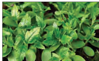
Klice z eliptičnimi kličnimi in nažaganimi primarnimi listi

Brekovo seme je globoko dormantno in osušljivo, zato ga je mogoče uspešno shranjevati za daljši čas, tudi do 7 ali 8 let. Pri shranjevanju nad temperaturo 25 °C se začne kalivost zelo zmanjševati. V enem kilogramu je od 25.000 do 40.000 semen. V našem poizkusu smo pri treh različnih drevesih na območju Bitenj (KE Kranj) ugotovili 36.756, 32.800 in 31.700 semen v kilogramu. Iz kilograma nabranih plodov smo pridobili 1.093, 577 in 746 semen. Za kilogram semen v povprečju potrebujemo 41,6 kilograma plodov. Povprečno število semen v plodu je v robnih populacijah 1,91, v centralnih populacijah 2,25, lokalno, zlasti v večjih