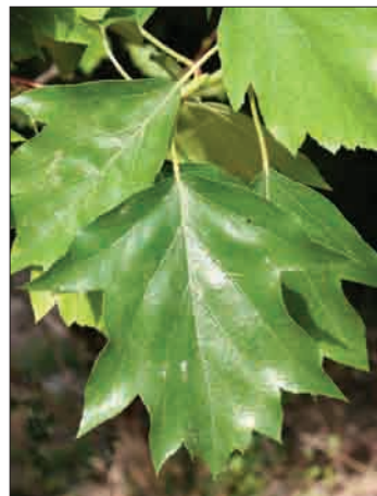
Prepoznavni, značilno širokokrpati listi

Brek avtohtono uspeva v večjem delu Slovenije. Najpogostejši je v sredozemskem svetu, najdemo ga v Slovenski Istri, na Krasu, v Čičariji, Vipavski dolini in Goriških brdih. Na planotastem kraškem delu Istre ga skoraj ne najdemo, pogosteje pa se pojavlja v osrednjem delu Istre v Šavrinskih brdih in vse do morja. Pojavlja se v vseh rastlinskih združbah in na vseh vrstah tal. Najbolj mu ustrezajo karbonatne rendzine na flišu na strmih pobočjih in planotastih grebenih ter globoka in z minerali bogata evtrična rjava tla na flišu. V sestojih se pojavlja posamezno ali v šopih kot primes v hrastovih gozdovih s puhastim hrastom ali cerom na rastiščih asociacije Sesleria autumnalis – Quercetum , ki je pogosta na južnih pobočjih na slabših suhih tleh. Na boljših rastiščih raste v združbi z gra-