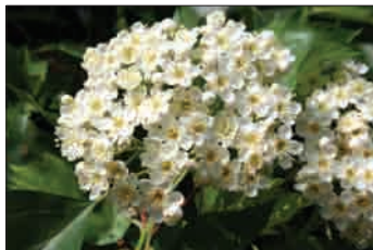
Brekovi cvetovi

vsebujejo veliko vitamina C in imajo nekaj zdravilnih lastnosti, saj pomagajo pri bolečinah v trebuhu in zapirajo. V bližini hiš ga včasih sadijo kot sadno, ponekod tudi okrasno drevo. V gozdu je brek zaradi plodov pomemben vir hrane za nekatere gozdne živali, predvsem miši, veverice, polhe, ščinkavce in druge ptice. Med cvetenjem povečuje estetsko vrednost gozda. Na velikem delu svojega areala je ogrožena vrsta. V zadnjih letih se zanimanje zanj zelo povečuje in mnoge dežele so že oblikovale posebne programe za njegovo dolgoročno ohranitev.