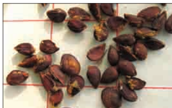
Brekova semena

V Sloveniji imamo štiri gozdne semenske objekte breka. V vseh štirih se pojavlja v sestojni obliki. Semenska sestoja v KE Rog in KE Koper sta tudi predlagana za gozdni genski rezervat.