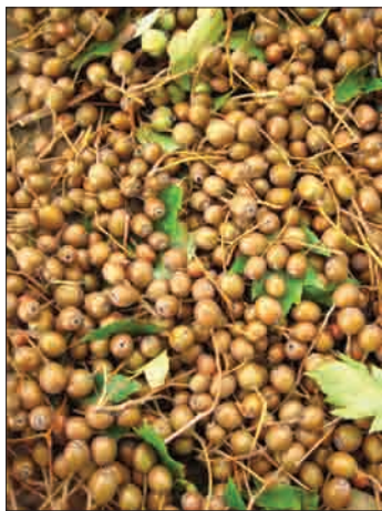
Plodovi po obiranju

nevarnost tudi uporaba semena, nabranega s premalo matičnih dreves, ali celo vnos sadik neznane provenience iz tujine. Značilnost večine predstavnikov rodu Sorbus je zmožnost njihovega medsebojnega križanja. Med brekovimi križanci je najbolj znan širokolistni mokovec ( Sorbus latifolia (Lam.) Pers.), ki je verjetno križanec med vrstama S. torminalis in S. aria in so ga našli leta 1790 v okolici Pariza. Tudi pri nas ga sadimo za okras. Pri tem je možnost povratnega križanja z brekom v naravnem okolju. Na genski sklad breka v naravnih populacijah bi nenazadnje kljub redki citoplazemski introgresiji lahko vplivalo tudi križanje z drugimi okrasnimi vrstami sorbusov, ki jih sadimo v urbanem okolju.