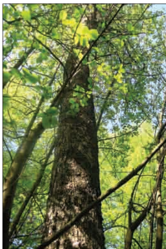
Brek z lepo raščnim deblom pri Negastrnu pri Moravčah

Pri breku bi poleg njegovega načrtnega in intenzivnejšega vnašanja v gozd lahko razmi-