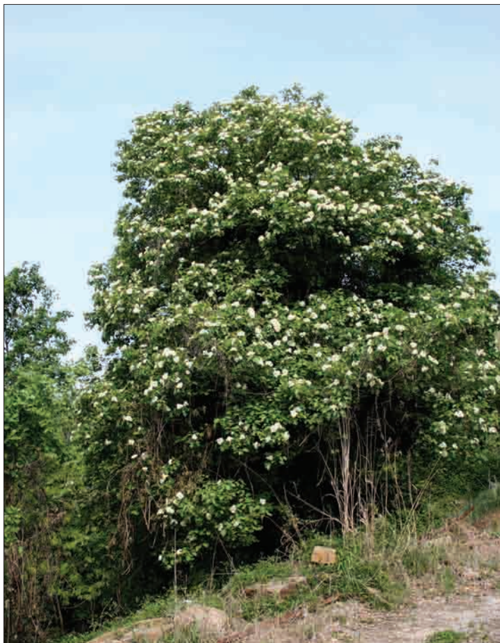
Široko razraščeno cvetoče brekovo drevo pri Izoli

4 Gozdarski inštitut Slovenije, Ljubljana, Slovenija