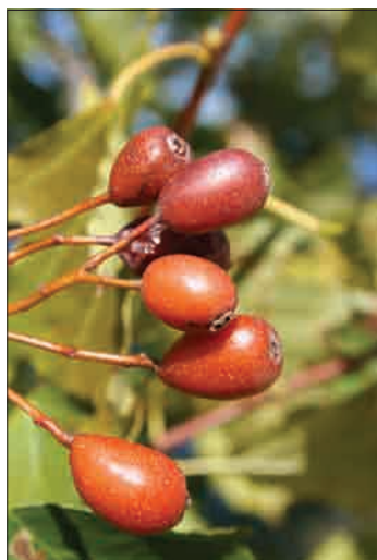
Zreli plodovi