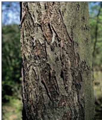
Deblo z značilno skorjo

Plodovi so užitni, umedeni po okusu spominjajo na hruške, nekatere na datlje. Uporabljajo jih za pripravo cenjenega žganja in za predelavo v marmelado, čežano, kis ali sok. Plodovi