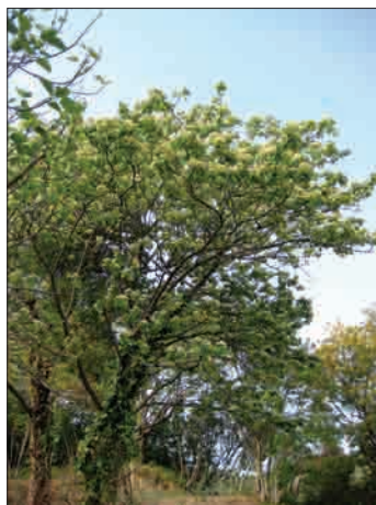
Cvetoče brekovo drevo pri Strunjanu

Ponudba brekovih sadik v Sloveniji ni stalna, na trgu se občasno pojavljajo sadike iz drevesnic ali ljubiteljske vzgoje. Ponudba je stalnejša v tujini, vendar sadik tujih provenienc v gozdarstvu ne uporabljamo.