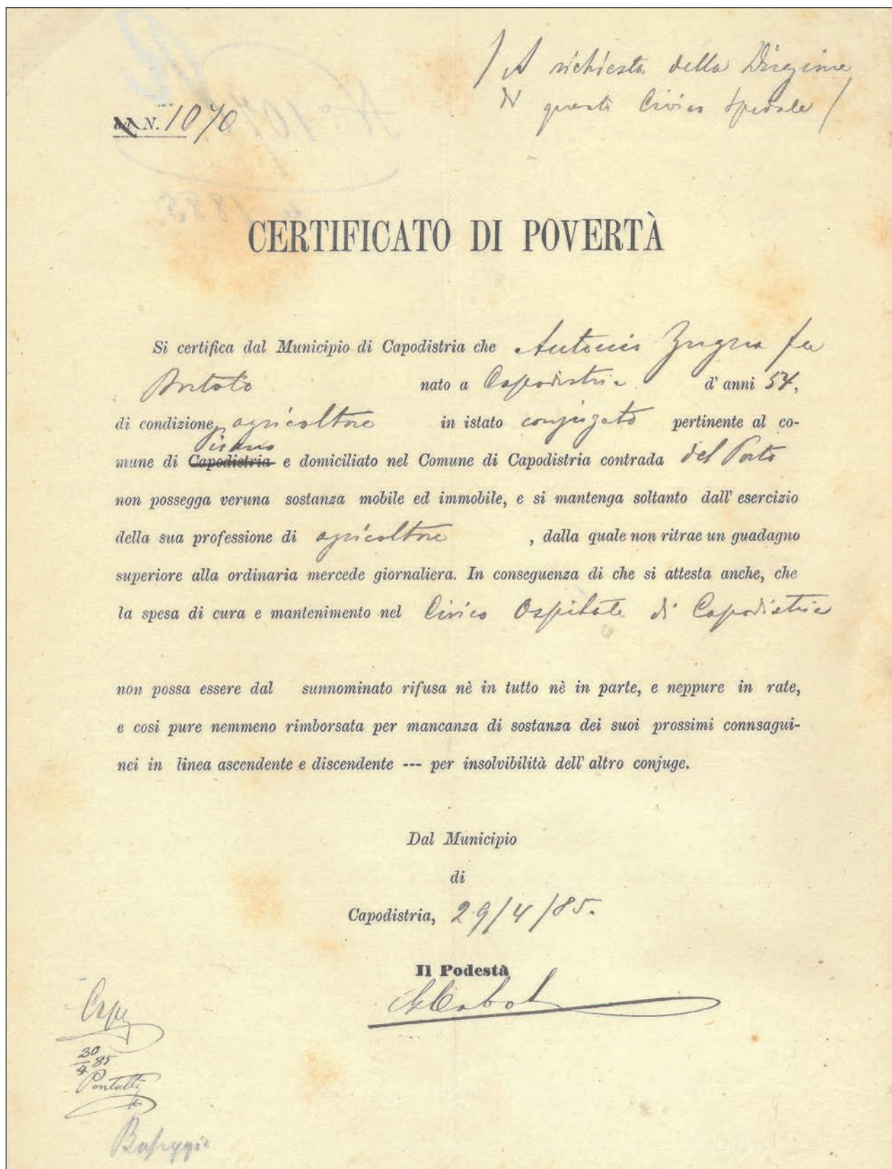
Slika 1: Primer potrdila o revščini, izdanega na koprski občini (PAK, SI-PAK-KP-7, t. e. 208, št. 1070).