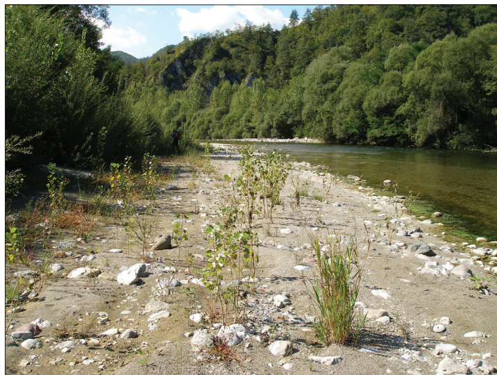
Slika 2: Naravno pomlajevanje črnega topola na rečnih nanosih Idrijce.

ne infrastrukture, urbanizacijo, kemizacijo v poljedelstvu, krčenjem gozdov za potrebe kmetijstva, sečnjo vitalnih dreves za potrebe pridobivanja lesa, intenzivnega objedanja živali in naseljevanja invazivnih rastlinskih vrst namreč še naprej prihaja do zmanjševanja, spreminjanja in propadanja