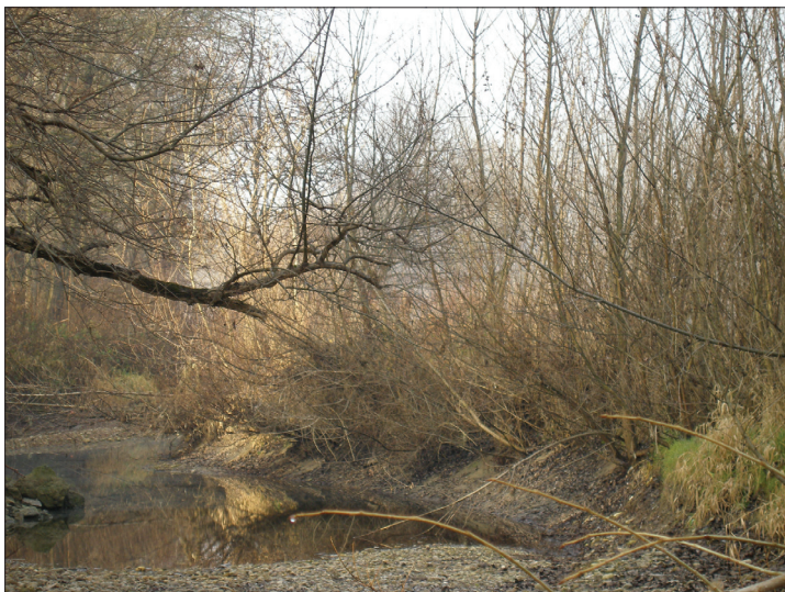
Slika 3: Naravno pomlajevanje črnega topola na rečnih nanosih Mure pri Melincih.

je namreč specifično in v Sloveniji odstopa od gospodarjenja z gozdovi gospodarsko pomembnih drevesnih vrst (npr. smreka, bukev) z uspešnim naravnim pomlajevanjem in zahteva večplastno povezovanje ob upoštevanju vseh funkcij, ki jih imajo gozdovi v tem območju. Pri načrtovanju različnih posegov se zahteva posebna skrb. Poplavne loge moramo varovati in jih ohraniti pred številnimi nepotrebni in celo barbarskimi človekovimi vplivi (npr. divja in legalna odlagališča odpadkov, zasipavanje mrtvic, vožnja z motorji). Tudi s prekomerni odvzemi rečnih naplavin so ogroženi naravni ekološki procesi v poplavnem gozdu. V rečnem prostoru se zmanjšuje sposobnost zadrževanja vode, uničuje se struktura in povezava med rečnimi in obrečnimi habitati. Vsa navedena dejstva pomenijo velik negativni vpliv na ohranjanje ogroženih