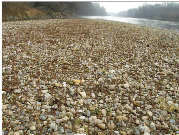
Slika 1: Neokrnjeni obrečni habitati so dom domačega črnega topola in vrh.