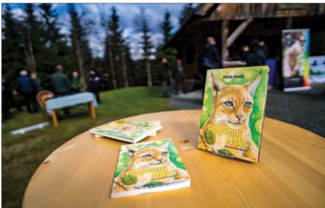
Slika 4: Knjiga Pogumni Maks.