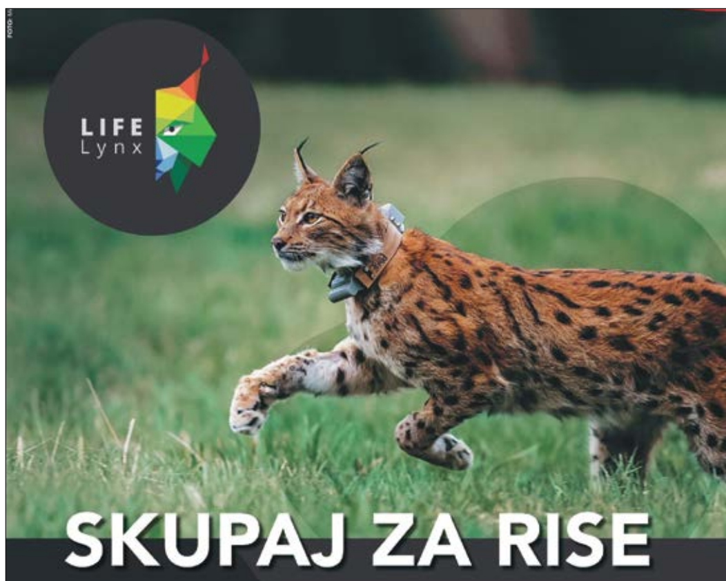
Slika 1: Plakat dokumentarnega filma – Skupaj za rise