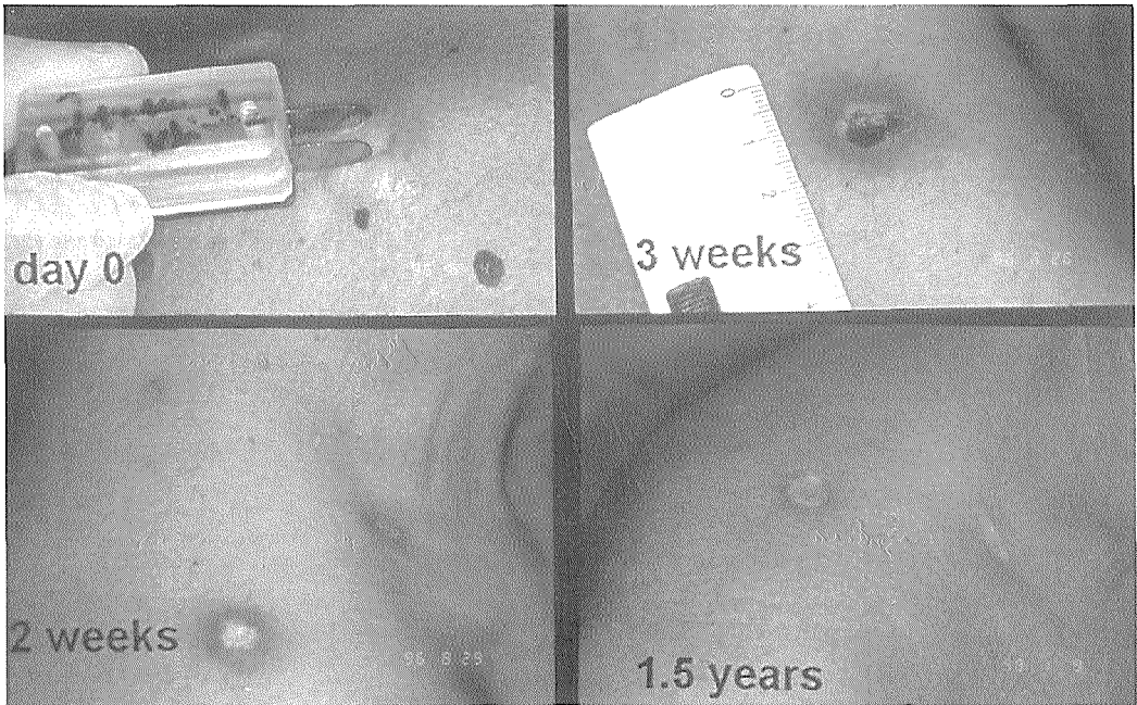
Slika 2. Učinek elektrokemoterapije s cisplatinom na kožne zasevke malignega melanoma. Po intratumorskem injiciranju cisplatina smo na tumor aplicirali osem električnih pulzov. Aplikator sestavljajo dve ploščati elektrodi vpeti v nosilec, ki je iz izolacijskega materiala. Viden je dober učinek terapije v različnih časovnih intervalih. Leto in pol po terapiji ni prisotnosti tumorja z dobrim kozmetičnim učinkom in le manjšo brazgotino.

Figure 2. Antitumor effectiveness of electrochemotherapy with cisplatin on skin metastases of malignant melanoma. After intratumoral cisplatin injection on the cutaneous nodule electric pulses were applied. Applicator consisted of two plate electrodes fixed in insulating holder. Good antitumor effect is demonstrated at various time points after the treatment. Also good cosmetic effect is seen.