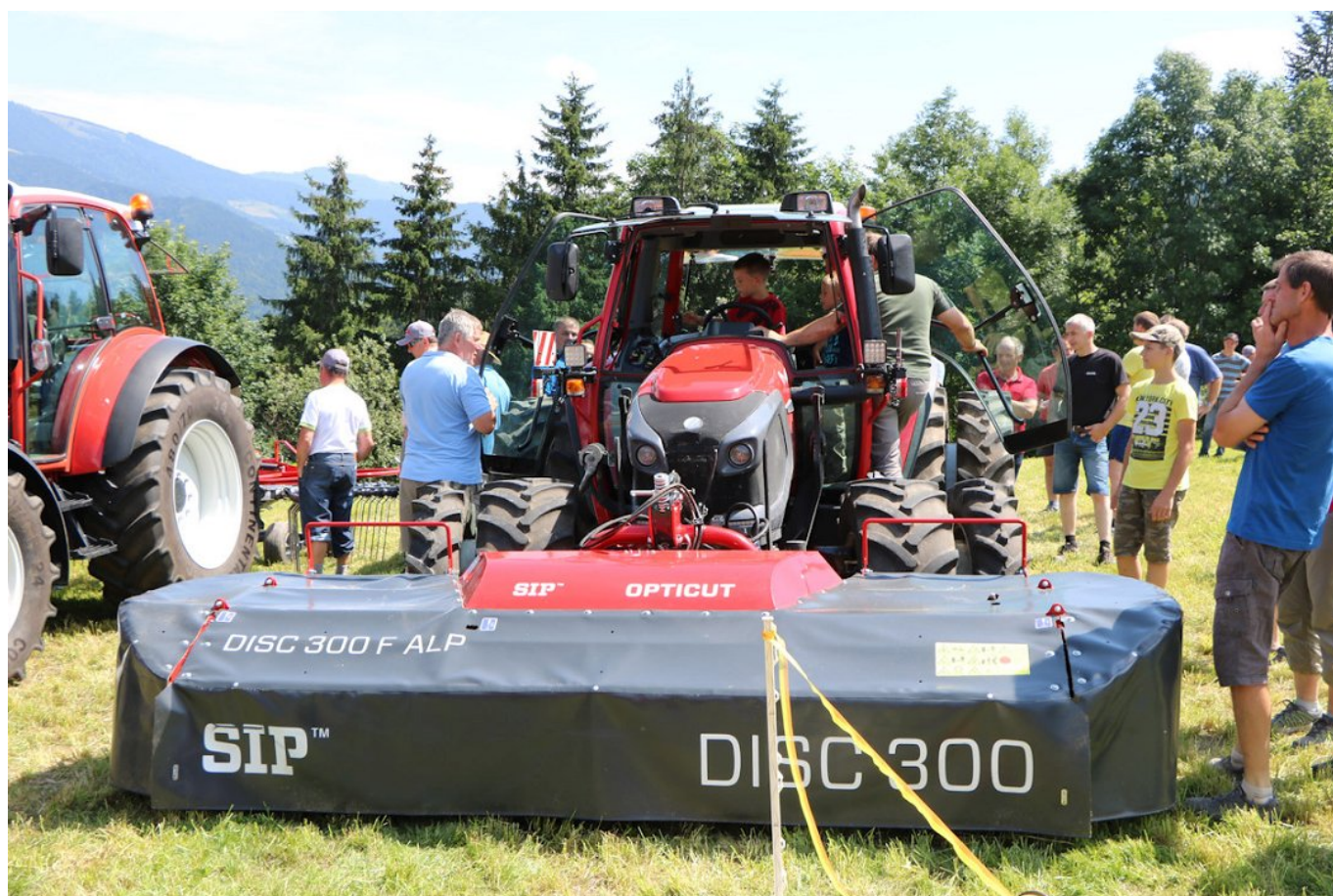
Slika 1: Otroke med odraščanjem na kmetiji zanima vse. Od živali do objektov, posebej pa jih privlačijo stroji, najbolj traktorji.

Otroke vsak dan odraščanja zanimajo živali na kmetiji, objekti, posebej pa jih privlačijo stroji, najbolj traktorji, pri tem pa na njih preži kup nevarnosti, ki se jih praviloma ne zavedajo. Včasih se dogaja, da mlajši otroci na kmetiji nimajo varstva, pa jih starši vzamejo s seboj na traktor. Po drugi strani pa otroci komaj čakajo, da jih odrasli vzamejo na traktor. Vožnja pa postane za otroke hitro monotona, pogosto zadremajo in omahnejo s traktorja, če niso ustrezno zavarovani in nesreča je zopet tu. Seveda je potrebno, da otroci v procesu odraščanja spoznajo delo na kmetiji, posebej še, če je ta otrok bodoči prevzemnik kmetije, a mora potekati otrokovi starosti primerno in brez izpostavljanju nevarnostim, za kar smo odgovorni odrasli.