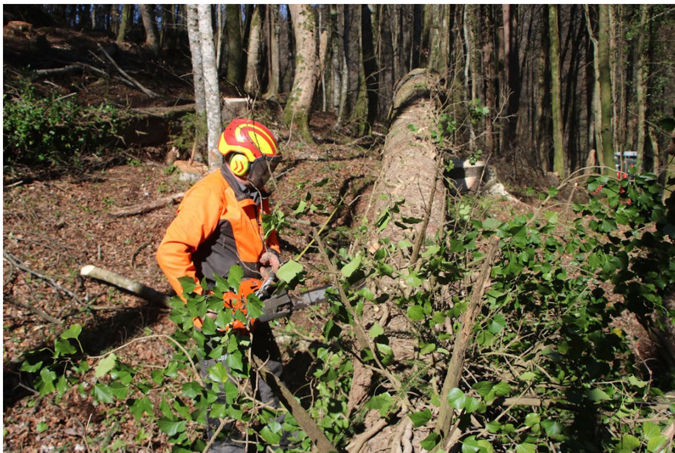
Slika 3: Delo v gozdu je tako nevarno, da otroci in mladostniki do dopolnjenega 15 leta starosti, ko se že lahko usposablja za varno delo v gozdu, pri podiranju in spravilu lesa nimajo kaj iskati.