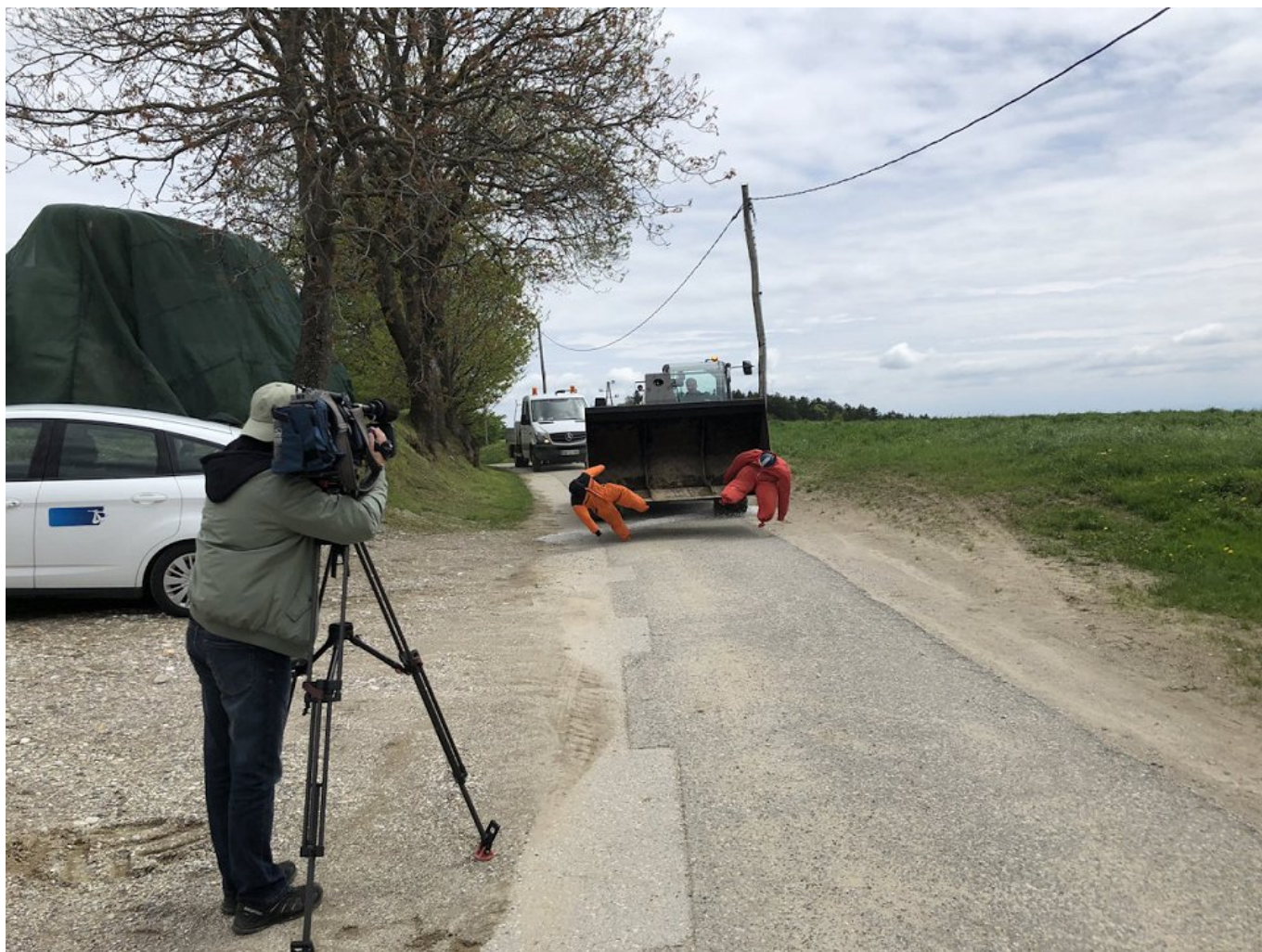
Slika 4: Prevoz otrok ali pa tudi drugih oseb v zajemalkah nakladalnikov ali na priključnih strojih, posebej sprednjih, je smrtno nevaren. Slika iz snemanja za oddajo Ljudje in zemlja (junij 2023) z lutkama.

Ne le zato, ker to po predpisih ni dovoljeno, temveč predvsem zato, ker je izjemno nevarno, se na traktorskih priključnih strojih ni dovoljeno voziti. Na traktorju ali na delovnem stroju se poleg voznika vozi druga oseba le, če je vgrajen sedež za sovoznika in vpisan v prometno dovoljenje. Otrok mlajših od enega leta in pol na traktorjih in delovnih strojih ni dovoljeno prevažati. Otroci, ki so starejši od enega leta in pol in manjši od 150 cm, pa se na teh vozilih smejo voziti le na sedežih z ustreznim zadrževalnim sistemom primernim otrokovi telesni masi. Za mlajše otroke lahko uporabimo običajni avtomobilski otroški sedež, ki ga pritrdimo na traktor. Tak sedež ima večtočkovne varnostne pasove, zato da so otroci varni, tudi če zadremajo. Za nekoliko starejše otroke pa so namenjeni posebni traktorski otroški sedeži. Ti morajo biti vzmeteni, da se na otroke ne prenašajo sunki in tresljaji, in opremljeni z večtočkovnimi varnostnimi pasovi, ki v vsakem primeru zadržijo otroka na sedežu.