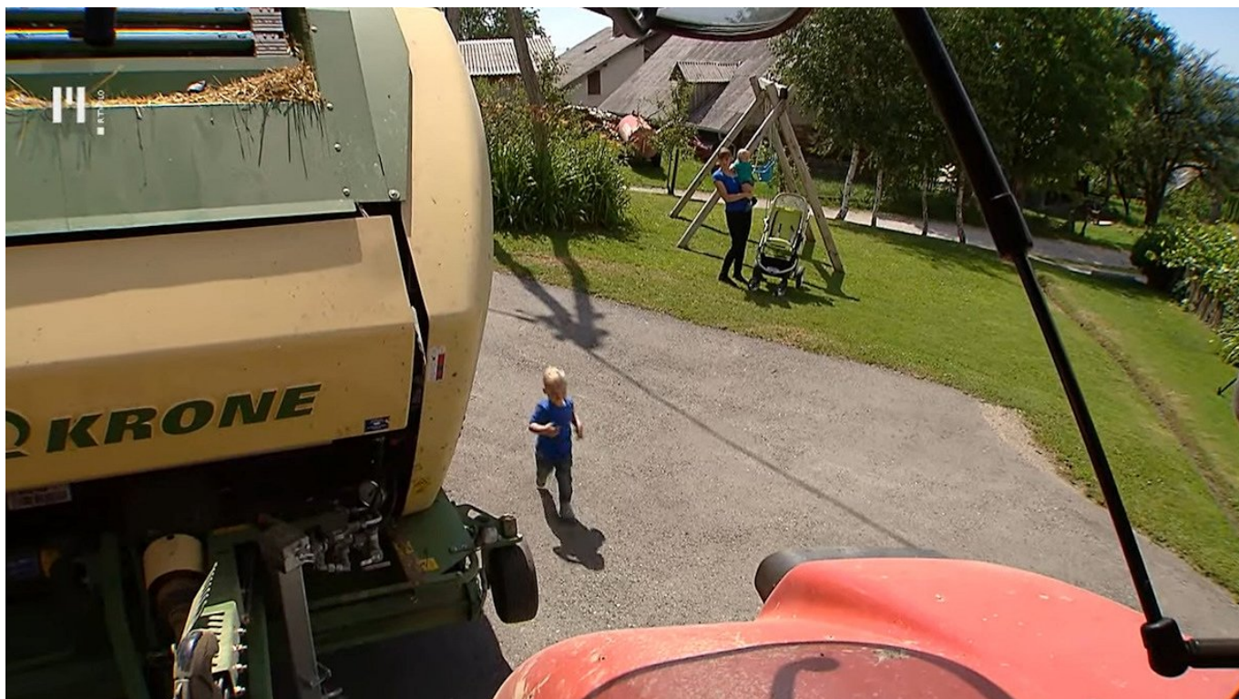
Slika 2: Največ nezgod se na kmetijah zgodi v povezavi s stroji, najbolj ogroženi pa so otroci do 5 leta starosti, saj še ne zaznavajo in se ne zavedajo nevarnosti. Slika: zajem zaslona oddaje Ljudje in zemlja, 2016.

Sledijo nezgode zaradi nezavarovanih premikajočih se delov strojev, padci v jame ali padci v zgradbah, nezgode pri stikih z živino, pa tudi padci v vodo. Kar nekaj nezgod pa se je zgodilo tudi pri padcih pri plezanju po balah, ki so bile zložene na dvorišču, ter padcih med valjaste bale. Kar nekaj naštetih nevarnosti preži na otroke, ki pridejo na kmetijo kot obiskovalci, in tem morajo še posebno pozornost posvetiti na turističnih kmetijah.