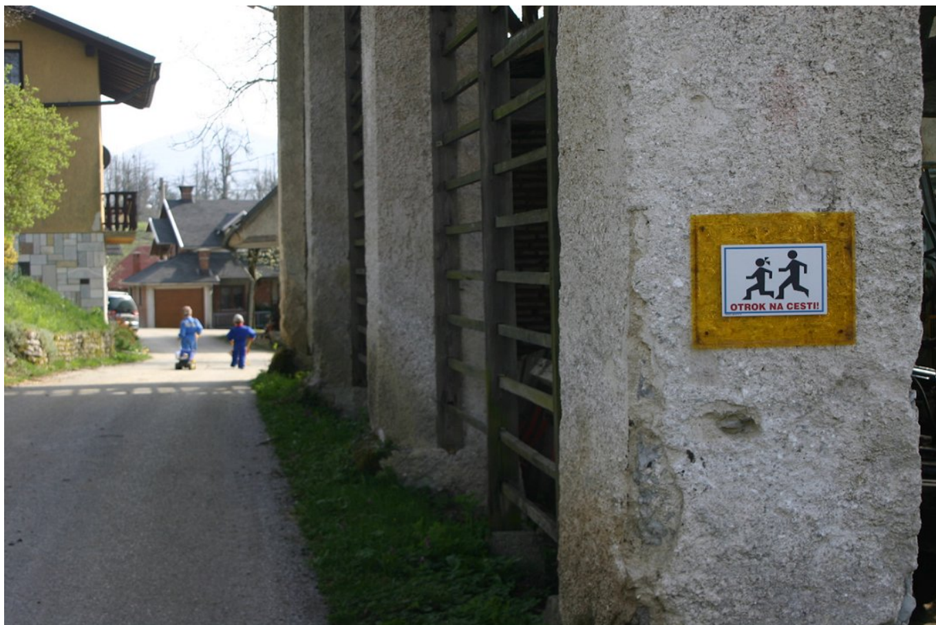
Slika 6: Na kmetijah so lahko mesto nevarnosti za otroke tudi dovozne ali dvoriščne poti, ki sicer niso namenjene javnemu prometu. S tablo pred dostopom na kmetijo obiskovalce opozorimo, naj bodo pozorni na otroke.

Idealno je, da za otroke zagotovimo varstvo, da priskrbimo igrala, prostor za igro, kjer bodo otroci toliko zaposleni, pa tudi nadzorovani, da ne bodo silili k strojem oz. v nevarnost. V kolikor na kmetiji za to ni moč poskrbeti in jih vzamemo s seboj na traktor, moramo poskrbeti, da bodo na traktorju tudi varni, v ustreznem vzmetenem otroškem sedežu z večtočkovnim varnostnim pasom oz. zadrževalnim sistemom. Sedež namestiti v kabino in nikoli na traktor brez kabine ali varnostnega loka. Takega traktorja že tako in tako ne smemo uporabljati, da bi pa na jih vozili še otroke, je pa povsem nedopustno. Če kabina ni dovolj dobro zvočno izolirana, naj otrok uporablja tudi otroške glušnike.