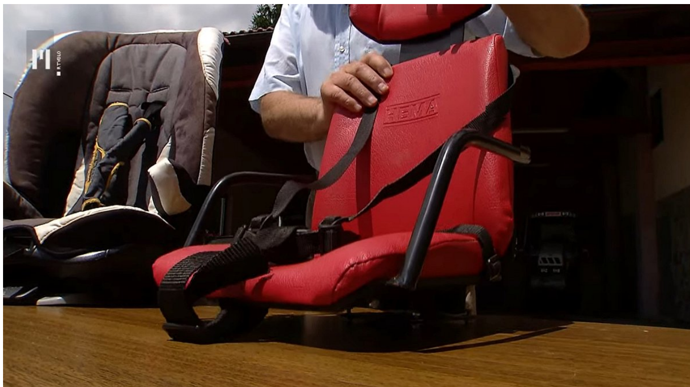
Slika 4: Za mlajše otroke lahko na traktorju uporabljamo avtomobilske otroške sedeže (levo), za nekaj starejše pa traktorske otroške sedeže (desno). Slika: zajem zaslona oddaje Ljudje in zemlja, 2016.

Na traktorskih priklopnikih se lahko vozi do 5 oseb, ki so potrebne za nakladanje ali razkladanje tovora, vendar ne smejo stati v tovornem prostoru, sedeti na stranicah priklopnika ali na tovoru, ki je višji od stranic priklopnika ali biti v neustreznem psihofizičnem stanju.