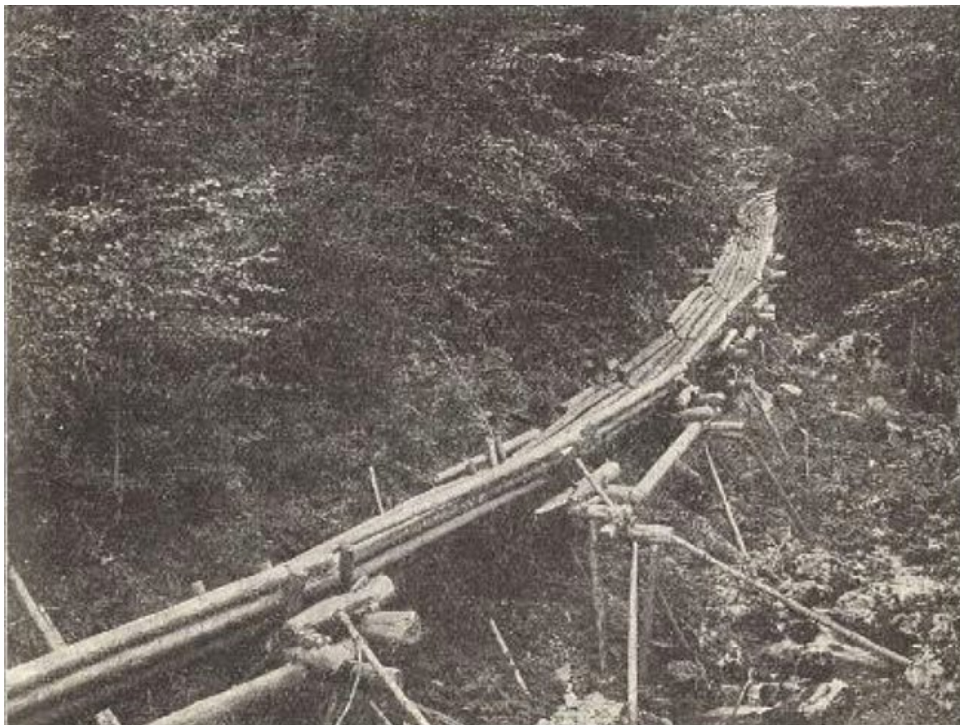
Slika 2: Lesena riža na Komarči v Bohinju (Šivic, 1923)

Spravilo posekanega lesa je potekalo po poteh in kolovozih, ki so jih imeli zgrajene v gozdovih. Pozimi so se predvsem uporabljale sani. Na nekaterih območjih so delali talne drče, po katerih so les spuščali po hribu, lahko po zemlji ali po snegu. Tako spuščanje je sicer na lesu, drevesih v bližini in tleh povzročalo veliko poškodb, tako da so v primerih, kjer je bila količina lesa večja napravili lesene riže. Narejene so bile iz hlodov, nekje so uporabljali tudi deske, obstajale so tudi vodne riže, kjer se je skozi speljala voda. Takih, ki so bile dolge po nekaj kilometrov je bilo kar nekaj, najdaljšo so imeli na posestvu grofa Attemsa na Pohorju, ki je bila dolga kar 13 km (Šivic, 1923).