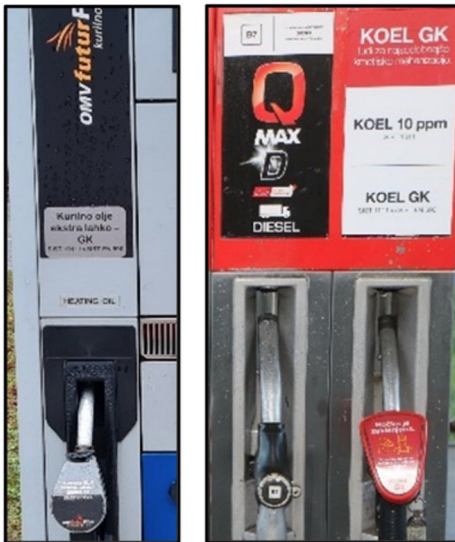
Slika 2: Primer označevanja točilnih mest

Gorivo za kmetijstvo bo mogoče kupiti na 262 bencinskih servisih (od skupaj 558 bencinskih servisov v Sloveniji). Seznam je objavljen na spletni strani strojnih krožkov. Višina trošarine za gorivo za kmetijstvo je enaka kot za kurilno olje ekstra lahko in je za 76 % nižja od trošarine za dizelsko gorivo. Zato je tudi drobnoprodajna cena goriva za kmetijstvo enaka ceni za kurilno olje ekstra lahko, kar je v prvi polovici marca 2023 pomenilo 1,078 €/liter. Cena dizelskega goriva je bila v enakem obdobju 1,489 €/l. Zavezanci za DDV tudi pri gorivu za kmetijstvo obračunajo vstopni DDV, oz. si ga povrnejo ob obračunu DDV.