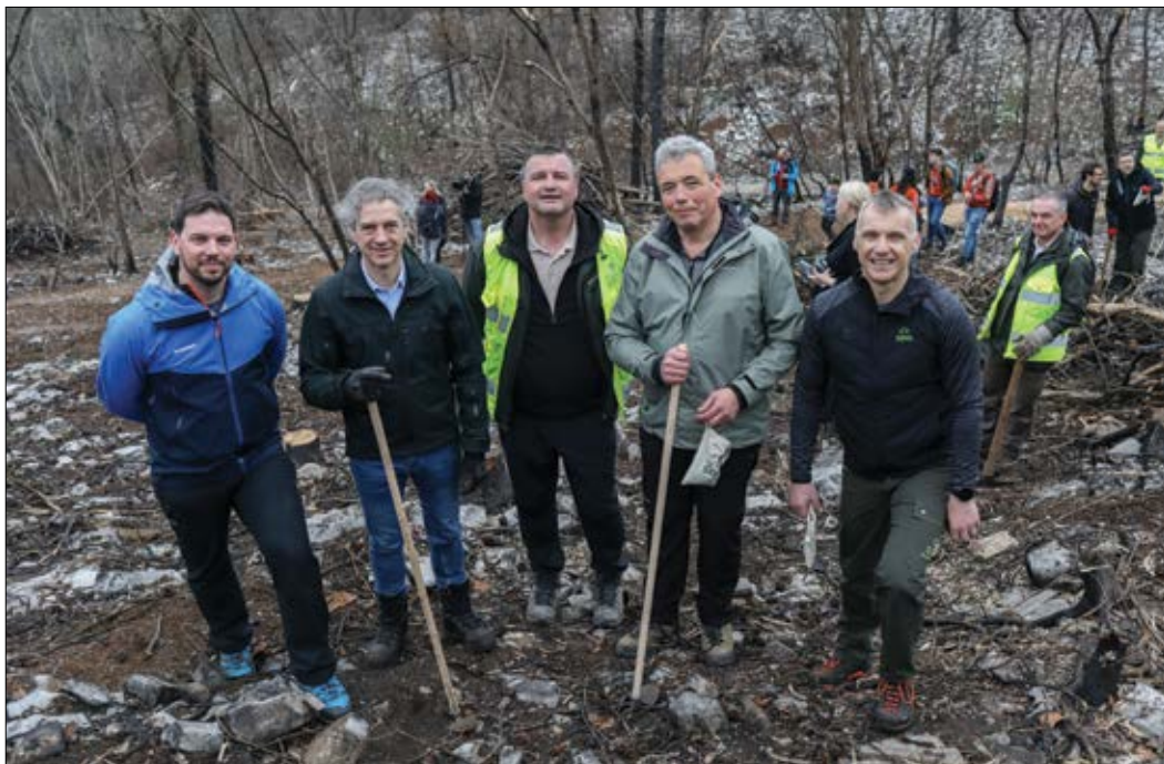
Slika 2: Akcije Pomladimo gozdove se je udeležil tudi premier

Suzana RANKOV Slovenski državni gozdovi d.o.o.