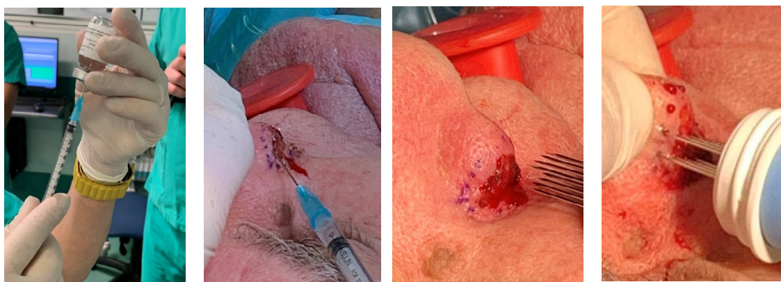
Priprava zdravila Volumen injiciranja= \frac{1}{4} volumna tumorja

V študiji testiramo 3 odmerke phIL12 (0,5 mg/mL, 1 mg/mL and 2 mg/mL). Odmerke plazmidne DNA, protokol elektroporacije in število ponovitev terapije smo določili v ne-kliničnem delu študije, ki smo jo izvedli z mišjim ortologom phIL12 (pmIL12). Zdravljenje izvajamo v splošni anesteziji ali sedaciji, odvisno od presoje anesteziologa. Plazmidna DNA injiciramo intratumorsko in 5 minut za tem dovedemo na tumor električne pulze, ki se uporabljajo za elektrokemoterapijo, z generatorjem električnih pulzov Cliniporator (slika 3). Po koncu terapije rano oskrbimo s standardnimi postopki. Ko se bolniki prebudijo iz anestezije, bo ocenjena toksičnost in morebitni neželeni učinki ter bolečina po zdravljenju (VAS lestvica). Kontrolni pregledi so predvideni 3, 8, in 31 dan, kjer bolnikom jemljemo brise iz mesta aplikacije plazmida, kri in bioptični vzorec za določitev farmakodinamike (koncentracija IL-12 in interferona \gamma v tumorju, število kopij plazmida v tumorju) in farmakokinetike (koncentracija IL-12 v serumu). Varnost terapije ocenjujemo po kriterijih CTCAEv5.0. Sprejemljivost terapije spremljamo z vprašalnikom o kakovosti življenja EORTC QLQ-C30. Odgovor tumorja se določa po RECISTv1.1 kriteriju.