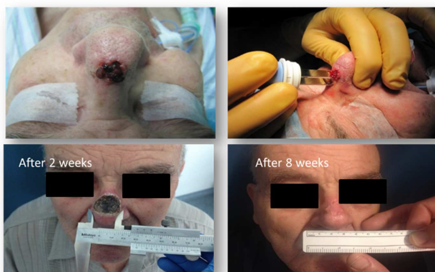
Slika 2: Slika 2. Zdravljenje in učinek elektrokemoterapije bazalnoceličnega karcinoma na nosu bolnika

Drugi dejavnik, ki se nam zdi zelo pomemben je imunogenost tumorjev. Na tumorskih modelih smo že pokazali, da je z večanjem imunogenosti tumorjev njihova odzivnost večja. Tako je bil tudi v predkliničnih poskusih maligni melanom najmanj odziven tumor. Na drugi strani pa smo pokazali, da z adjuvantnim zdravljenjem z interlevkinom-12 (IL-12) lahko povečamo odzivnost tumorjev. Najbolj je bil protitumorski učinek povečan pri manj imunogenih tumorjih in najmanj pri bolj imunogenih tumorjih, ki odgovorijo dobro že na samo terapijo z elektrokemoterapijo. Elektrokemoterapijo bi lahko imeli kot in situ vakcinacijo organizma. Klinična študija, ki smo jo objavili potrjuje to možnost. V InspECT bazi smo zbrali bolnike z napredovalno boleznijo in s kožnimi metastazami melanoma, ki so bili zdravljeni s pembrolizumabom in smo jim kožne metastaze dodatno zdravili z elektrokemoterapijo. Študija je pokazala da, v primerjavi s primerljivima skupinama bolnikov, ki so bili zdravljeni samo z elektrokemoterapijo in skupino, ki je bila zdravljena samo s pembrolizumabom, elektrokemoterapija doprinese k lokalnem učinku na kožnih metastazah, kot tudi izboljša sistemski odgovor zdravljenja, tako na oddaljenih zasevkih kot tudi s povečanim celokupnim preživetjem. Zato se nam zdi smiselno, da gredo raziskave v smeri kombiniranega zdravljenja elektrokemoterapije z zaviralci imunskih kontrolnih točk, ali pa z imunogeno terapijo, ki jo razvijamo, s plazmidom z zapisom za IL-12.