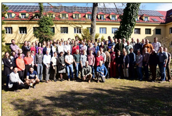
Slika 1: Skupinska slika udeležencev srečanja »Forest Protection Colloquium« na Dunaju.

Avstrijski raziskovalni center za gozdove (Das Bundesforschungszentrum für Wald – BFW) na Dunaju je med 21. in 22. marcem 2023 gostil regionalno srečanje s področja varstva gozdov “ Forest Protection Colloquium ”. Srečanje je po petih letih premora ponudilo novo priložnost za srečanje strokovnjakov s področja varstva in zdravja gozdov. Preko 80 udeležencem iz 20 držav smo se tokrat iz Slovenije pridružili štirje predstavniki z Oddelka za varstvo gozdov Gozdarskega inštituta Slovenije, ki smo svoje delo predstavili v štirih predstavitev in s tremi posterji.