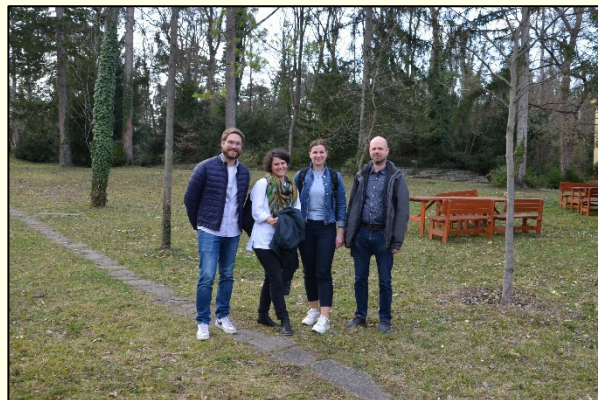
Slika 4: Skupinska slika udeležencev srečanja iz Slovenije.

Srečanje s področja varstva gozdov na Dunaju je ponudilo izmenjavo informacij o aktualnem dogajanju na področju škodljivih organizmov in rastlinskih boleznih ter spremljajočih novih ugotovitev o zdravju evropskih gozdov. Hkrati pa tudi enkratno priložnost za ponovno srečanje kolegov iz tujine in pletenje novih mednarodnih povezav, izmenjavo izkušenj in snovanje idej za nove skupne projekte.