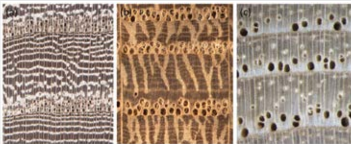
Slika 4: Med pomembnejšimi razlikovalnimi znaki domačih venčasto poroznih vrst je razporeditev trahej v kasnem lesu; pri brestu so razporejene v valovitih tangencialnih nizih (a), pri hrastu ( Quercus robur L.) v radialnih nizih (b), pri jesenu ( Fraxinus excelsior L.) (c) pa so traheje kasnega lesa posamične in razporejene difuzno.