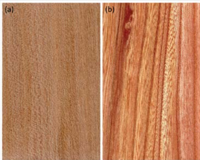
Slika 3: Radialna (a) in tangencialna (b) tekstura brestovega lesa.