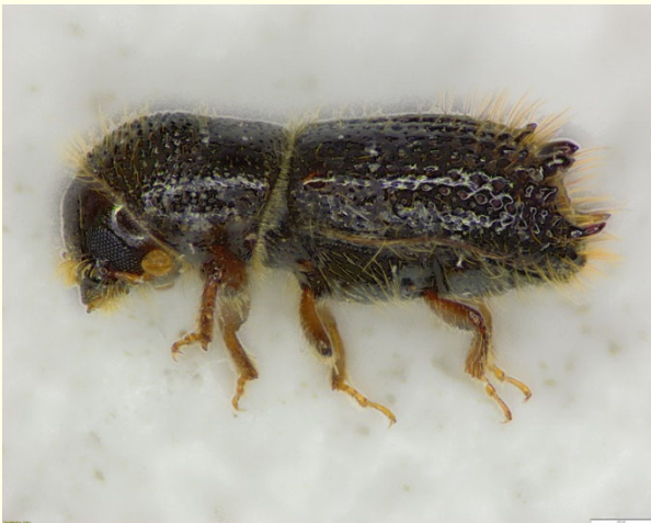
Slika 1: Vorontzowov vejni lubadar ( Pityokteines vorontzowi )