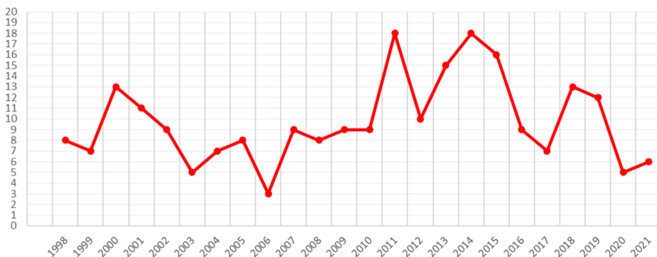
Slika 1: Število nezgod s smrtnim izidom med nepoklicnimi delavci pri delu v gozdu 1998 – 2021.

V primerjavi s prejšnjim obdobjem, ko je bil razviden izrazit trend naraščanja smrtnih delovnih nezgod v gozdu, se je v zadnjem obdobju trend umiril. V letu 2020 in 2021 je na aktivnost gospodarjenja vplivala tudi epidemija COVID-19, saj je bil leta 2021 izvedeni posek v zasebnih gozdovih najnižji v zadnjih 8 letih.