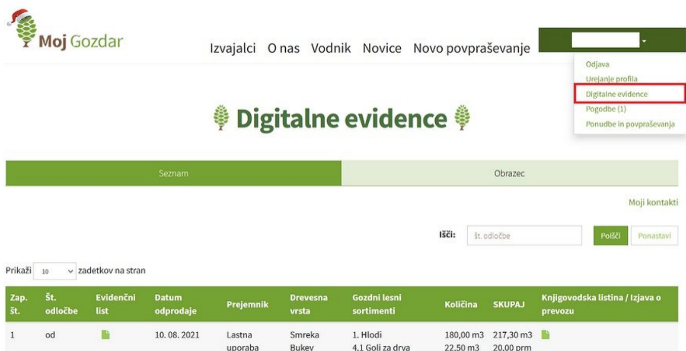
Slika 5: Orodje za pripravo in vodenje digitalnih evidenc (vodenje potrebne skrbnosti in sledljivosti z gozdnimi lesnimi sortimenti) v spletnem sistemu MojGozdar.

Uporabniki si lahko pri praktični uporabi orodja Digitalne evidence in vnašanju podatkov pomagajo z video navodili. Uporabnike vabimo k ogledu video navodil z naslovom Sistem potrebne skrbnosti in sledljivost gozdnih lesnih sortimentov za zasebne lastnike gozdov (povezava: www.youtube.com/watch?v=INbgJ2kjr7I )